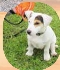
Pack, Match Show II