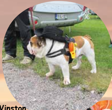
Sir Winston Match Show I