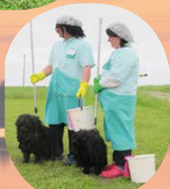
Siivouspartiokoirat, Naamiaisten voittajat