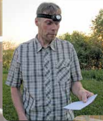
Yösuunnista- jana yöttö- mässä yössä Antti