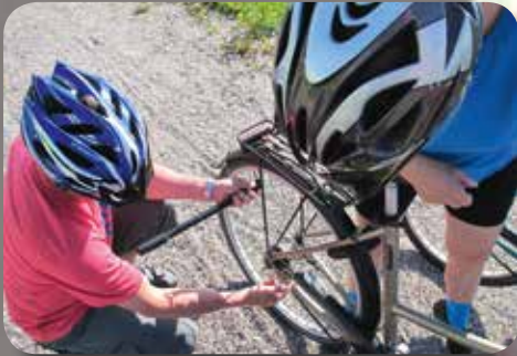
Pyörän huoltoa ennen lenkillelähtöä