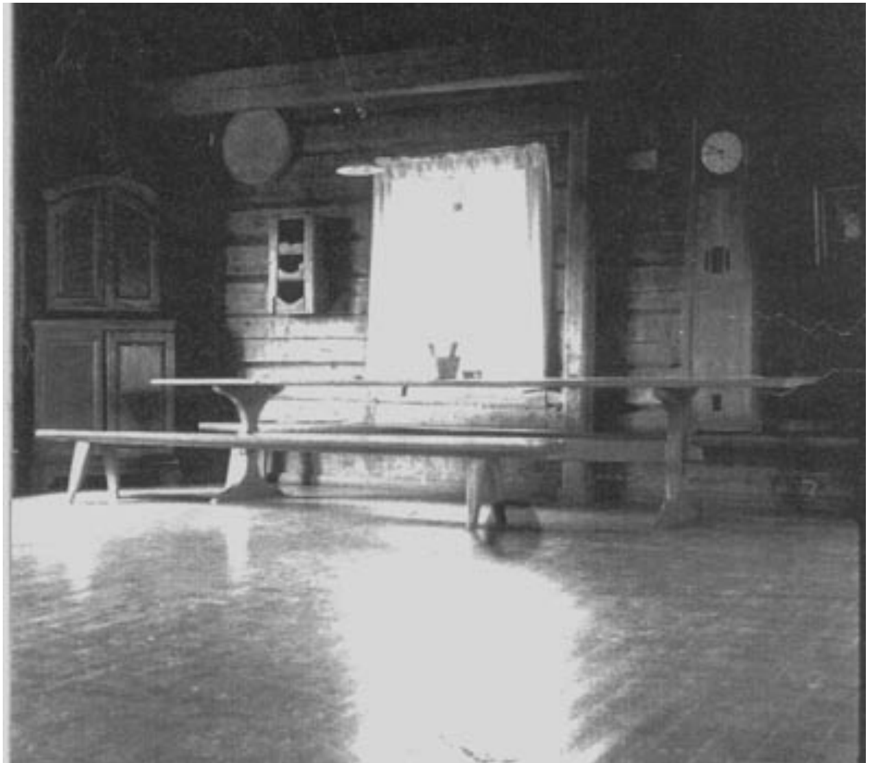
Vanhan Laitilan tupa