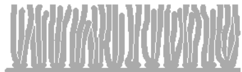
Kuva 2. Leikattu nukkapinta on "tasaisen epätasainen" ja eläväpintainen, mutta siisti.