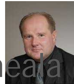
Insinööri-toimisto Kai Kouvo Ky