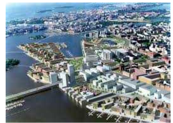
Maankäyttö ja aluerakentaminen