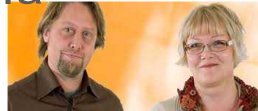
Tekniikan erikoisammattitutkinto, HAMK

http://portal.liikennevirasto.fi/portal/page/portal/f/liikennevirasto/tutkimus_kehittaminen/120220_Osaamisen_nykytila.pdf