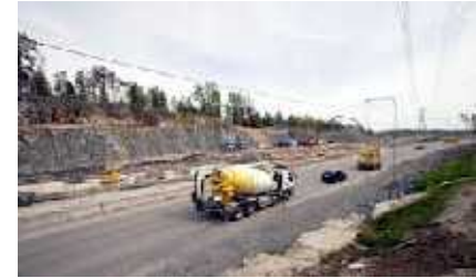
Infra ry: merkittävä tekijä kansantaloudessa