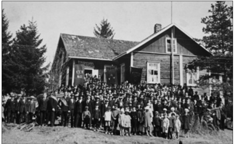
Ohkolan ja Kellokosken työväenyhdistysten yhteinen vappukulkue vuonna 1928 on saapunut Ohkolan työväentalolle.