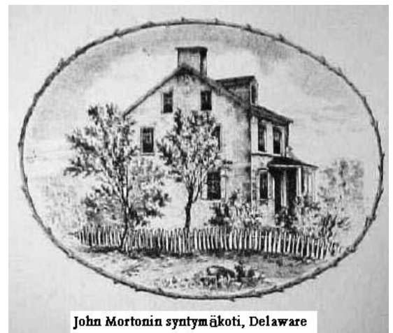
John Mortonin syntymäkot, Delaware

On myös paljon henkilöitä, jotka eivät ole kuulleet omasta perhehistoriastaan mitään. Nuorena sukuasiat eivät kiinnostaneet ja myöhemmin, kun asiat alkoivat kiinnostaa, kertojat olivat jo kuolleet. Sukuseurana ja sukuseuran jäsenenä voimme täydentää tätä aukkoa kokoamalla Marttisten historiaa, sukutarinoina, kuvina ja erilaisina julkaisuina tuleville sukupolville.