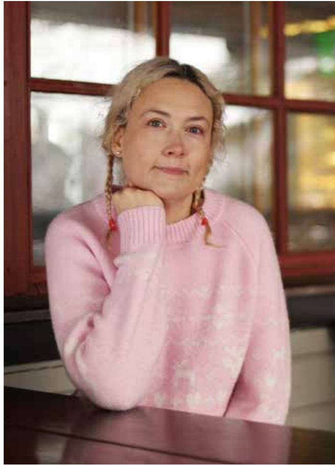
– Ihminen etsii valtaa ja taistelee itseänsäkin vastaan, puut hyväksyvät elämänsä ja kohtalonsa, Jippu vertaa.

– Isäni elämäntapaan kuului kurinalainen keuhonhuolto. Hän teki päivit-