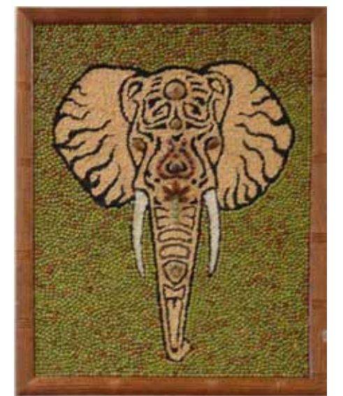
Siemenet sopivat hyvin taiteen tekemiseen.