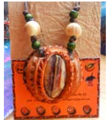
Iri Ra valmistaa koruja myös avokadon kivistä.

missa ja Jumalassa, ja on vaikeampi maadottua.