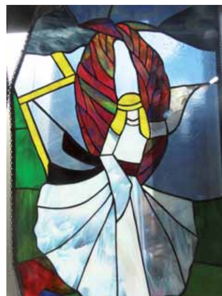
Saattohoidon tehtävänä on hoitaa potilasta niin, että hänen viimeiset viikkonsa ovat mahdollisimman hyviä.

Kun mitään ei ole tehtävissä, on vielä paljon tekemistä