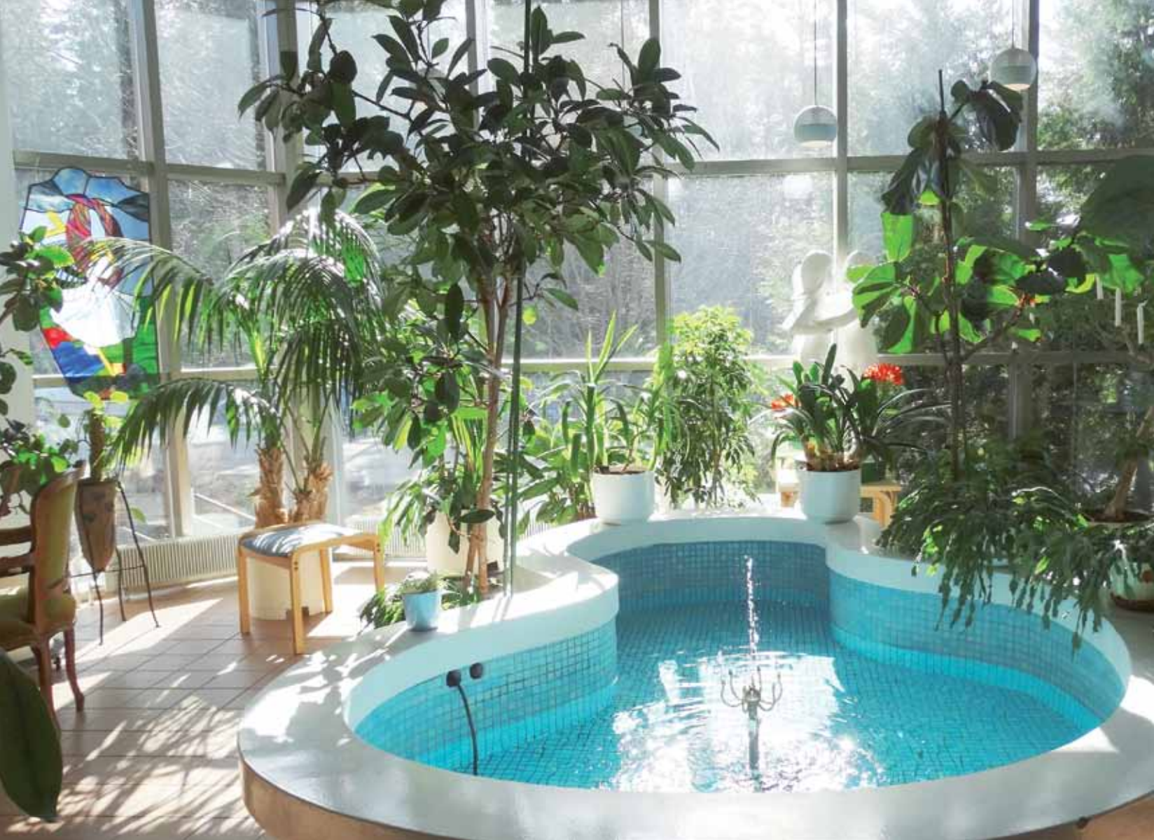
Pirkanmaan Hoitokodin viihtyisä ja elämyksellinen ympäristö tuo levollisuutta potilaille, omaisille, henkilökunnalle ja vierailijoille.