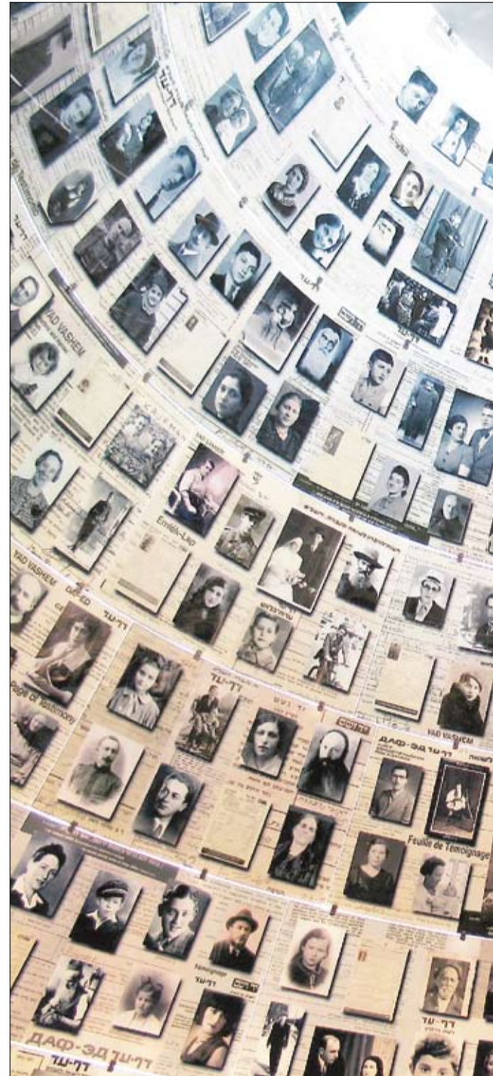
Yad Vashemiin on jo koottu holokaustin kuudesta miljoonasta juutalaisesta 56:5: ”Heille minä annan huoneessani ja muurieni sisällä muistomme.”

– Holokaustissa juutalaisten ”ristinnaulitsijat” olivat lähes poikkeuksetta kris-