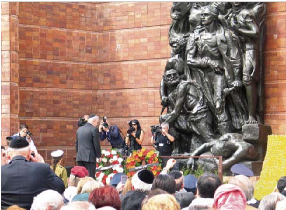
Holokaustin Yom HaShoah -muistopäivää vietetään Israelissa toukokuussa. Pääministeri Benjamin Netanyahu laski seppeleen Varsovan gheton aukiolla sijaitsevalle muistojen muurille Yad Vashemissa. Sireenit soidessa vietetään kahden minuutin hiljainen hetki.

Natsit halusivat uuden maailmanjärjestyksen, jossa muut kansat olivat heidän alapuolellaan.