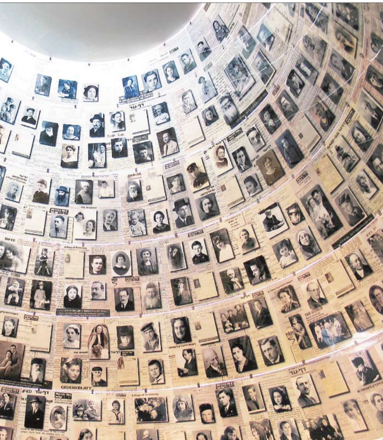
alaisuudesta jo neljän miljoonan tiedot muistokirjoihin, monista heistä on myös kuva. Keskuksen nimi tulee Jesajan kirjan kohdasta Jerkin ja nimen, joka on poikia ja tyttäriä parempi; minä annan heille iankaikkisen nimen, joka ei häviä”.