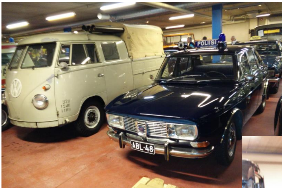
Eräs poliisiautoista ja volkkari