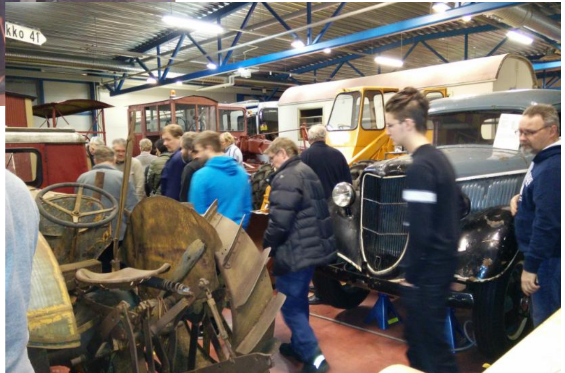
Vierailijat vaeltavat kalustohallissa