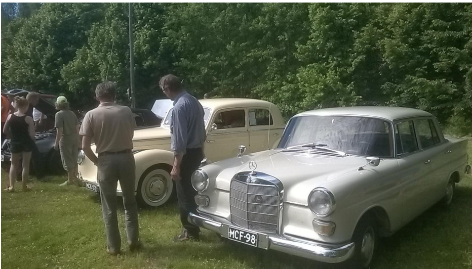
Kangasalan edustus Orimattilassa

Kaikenkaikkiaan koimme mukavan mersuhenkisen kesäpäivän, varmaan tulee lähdettyä toistekin.