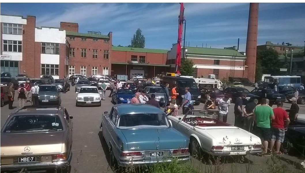
Mersuja ja mersukansaa