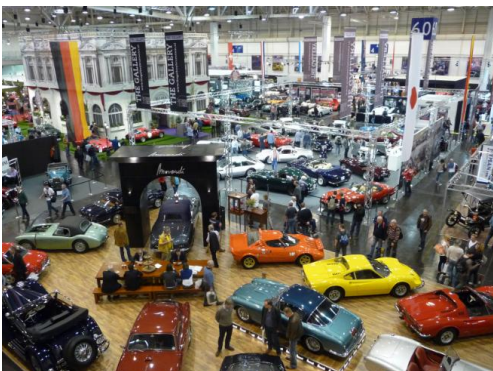
Muitakin osastoja löytyi