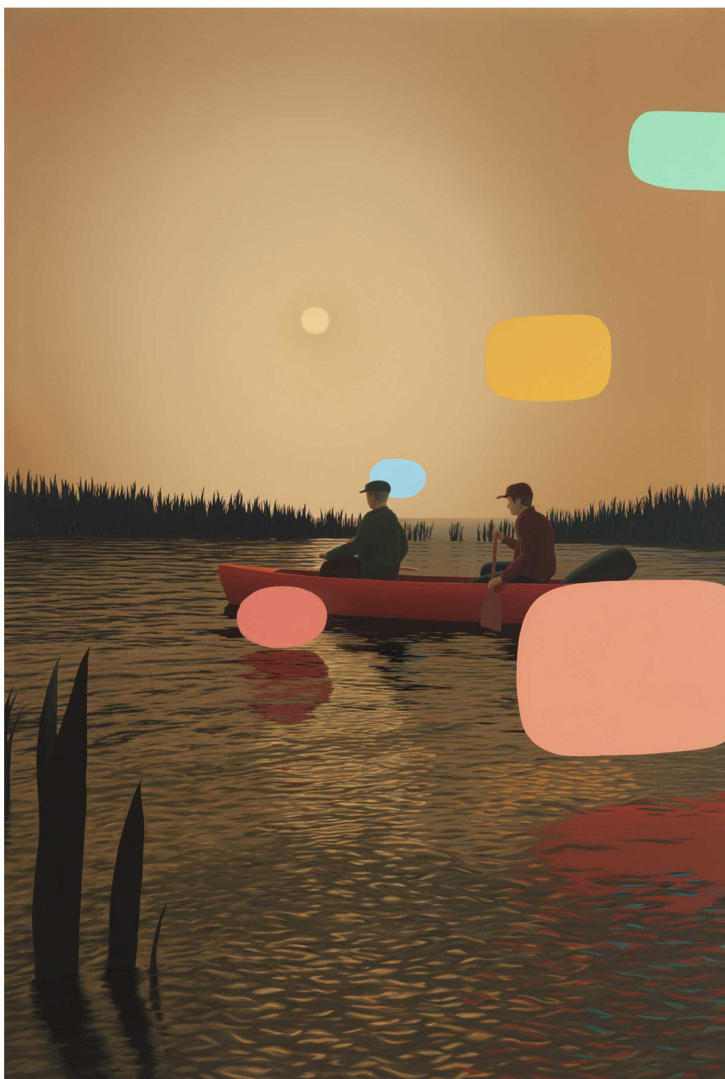
Tarinoitsija/The Storyteller , 2019 Öljy kankaalle, 200x135cm