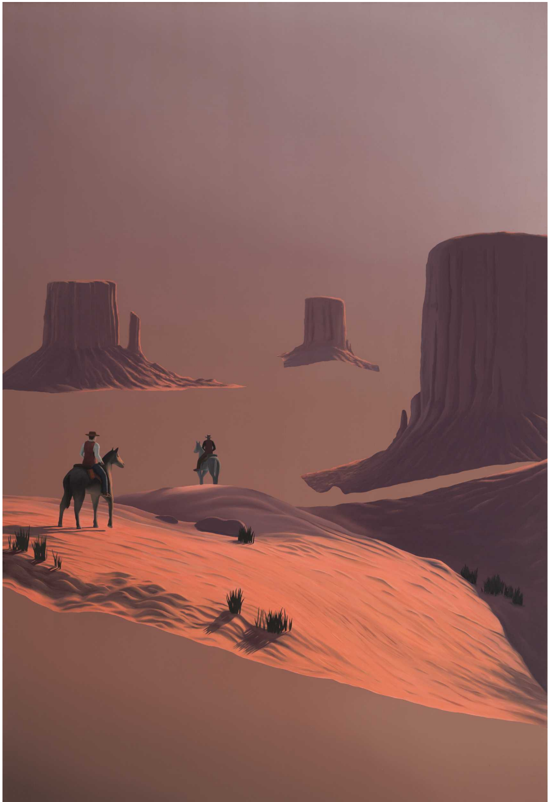
Bromance , 2019 Öljy kankaalle, 200x135cm