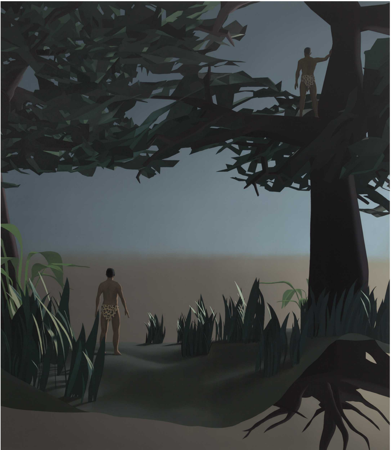
Haalistuneet sankarit/Faded heroes, 2019 Öljy kankaalle, 210x180cm