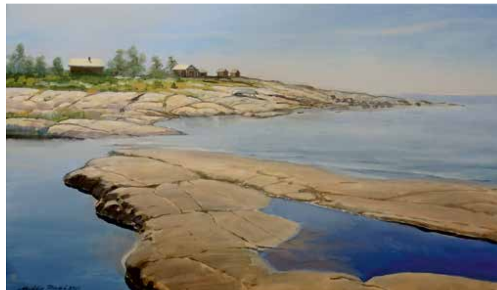
9. Meri. / öljyväri 2021 / Hinta 2500,-