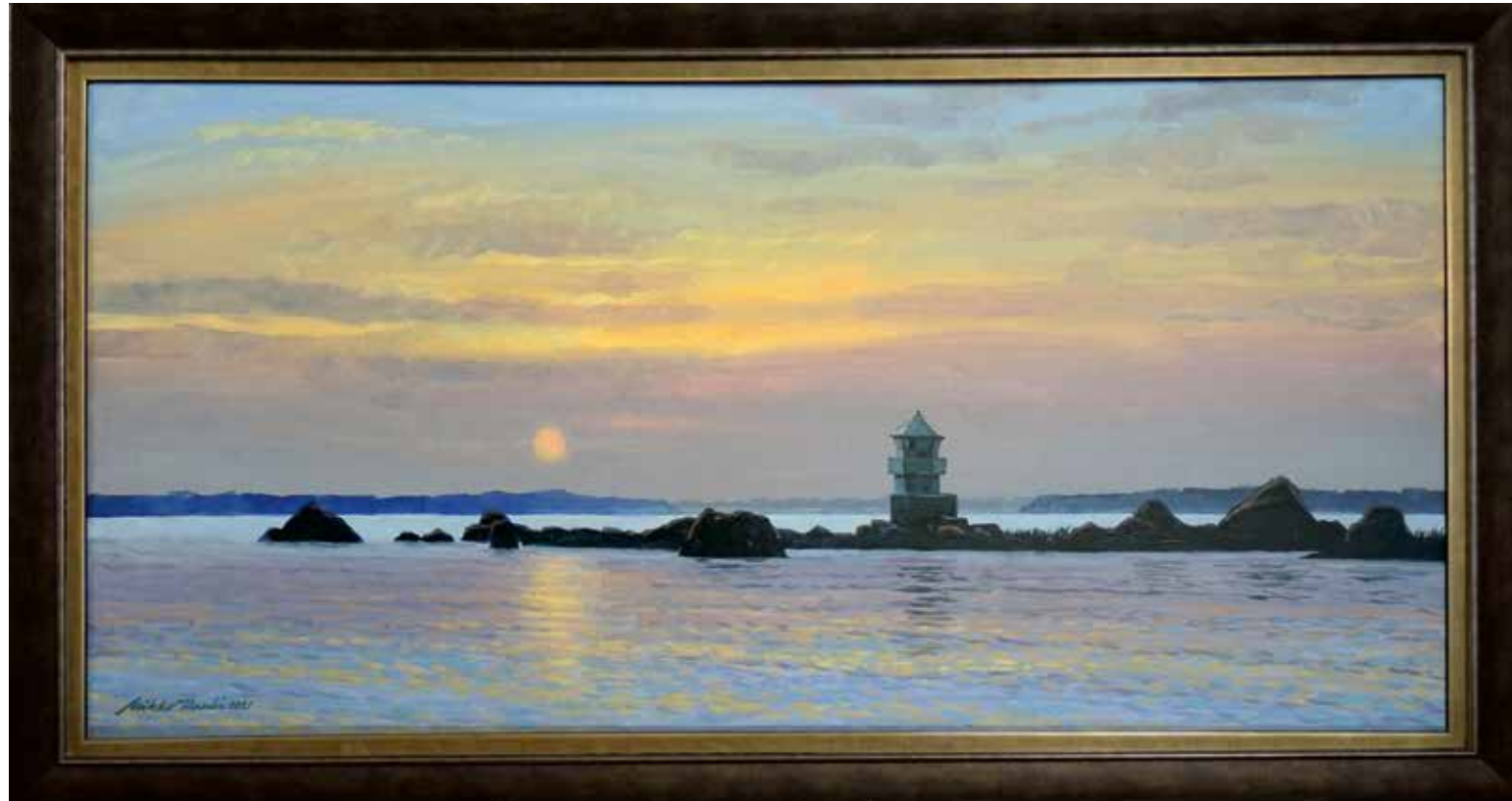
6. Lotourin loisto Tammion itäpuolella. / öljyväri 2021 / Hinta 1200,-