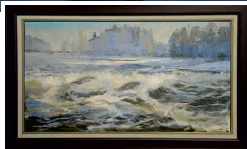
14. Langinkoski. Öljyväri 2021 / Hinta 800,-