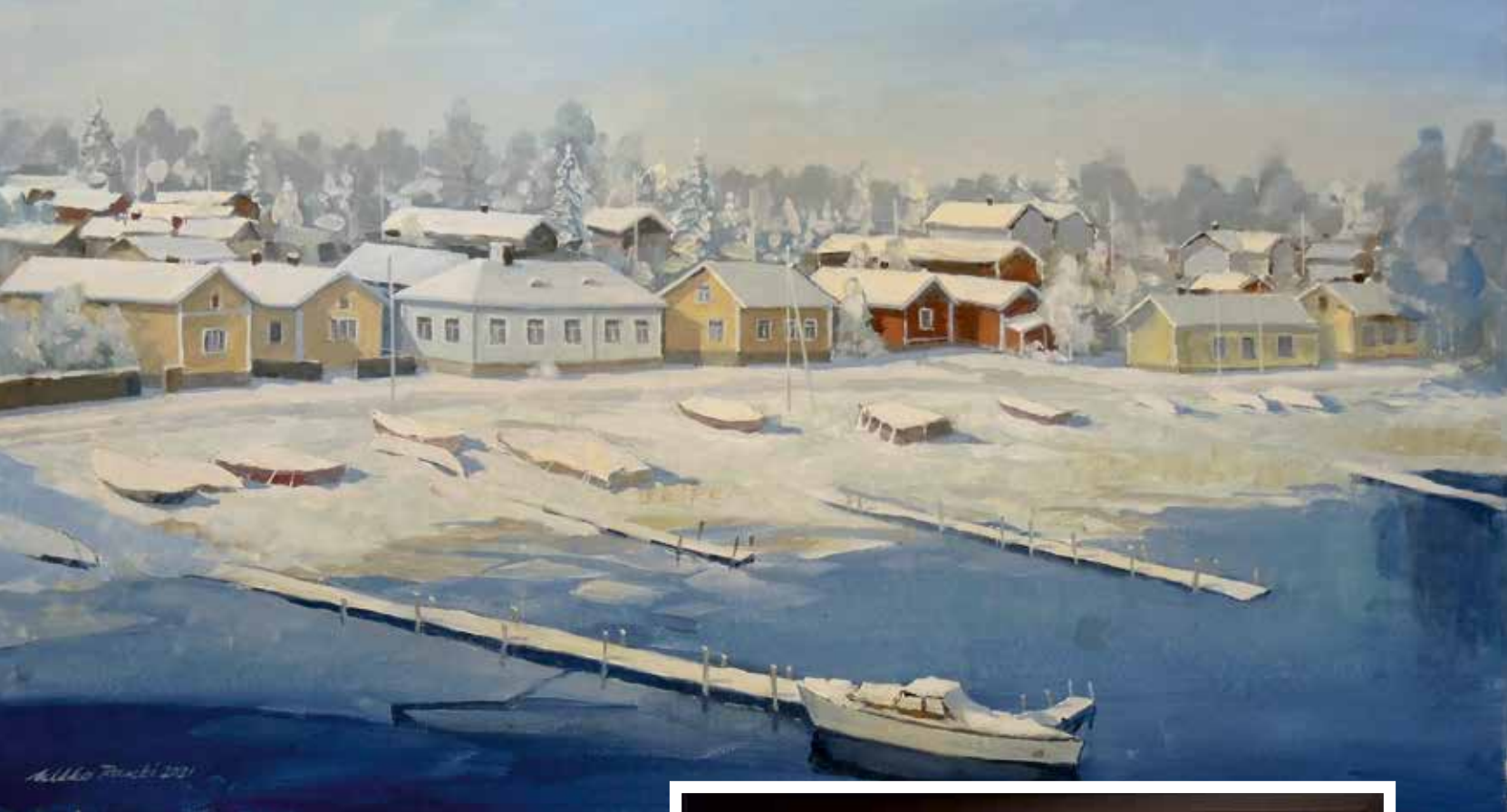
13. Haminan Pitäjänsaari n. 70-luvulla. Maalattu Kauko Tiilin valokuvaa mukaellen. Öljyväri 2021 / Hinta 800,-