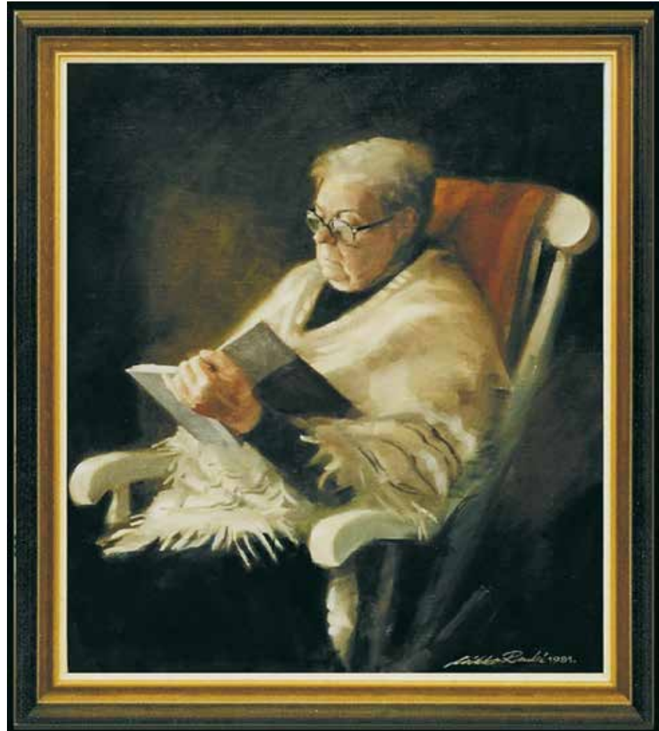
19. Äiti, nukkuu vai lukee. / Öljyväri 1981 / ●