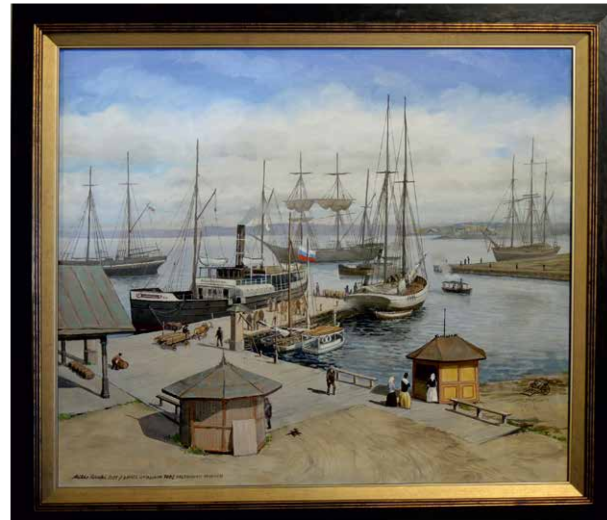
1. Kotkan kantasatama 1896 Daniel Nyblinin valokuvaa mukaellen / öljyväri 2021. ● Maalauksessa näkyvä laituri ja poukama ovat juuri siinä mistä nykyisin alkaa Merikeskus Vellamon katolle menevä luiska. Oikealla kaukana taustalla hämöttää Hietanen.