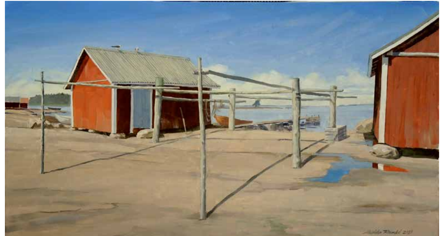
7. Tammion rantavajat. / öljyväri 2021 / Hinta 800,-