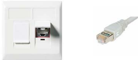
Kuva 1. Puhelimien pistorasia ja puhelinjohto

Kun kytken puhelimen verkkoon, puhelimen näyttöön pitäisi tulla kyseisen puhelimen numero (11, 12, 13 tai 14). Huomaa, että soittaessa käytetään vain puhelimen viimeistä numeroa 1, 2, 3 tai 4.