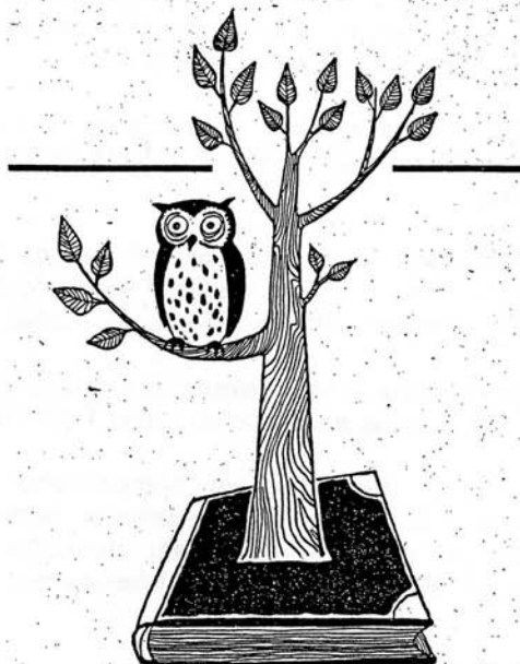
MYK:n "logo" 1950-luvulta