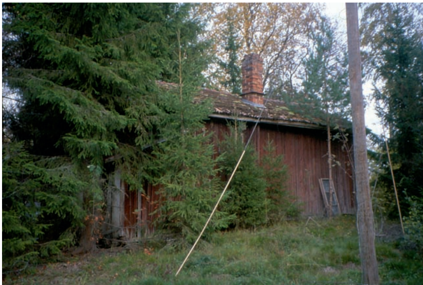
Pöllölän pikkuinen mökki, jossa viimeksi asui kartanon sianhoitaja, on vielä pystyssä.