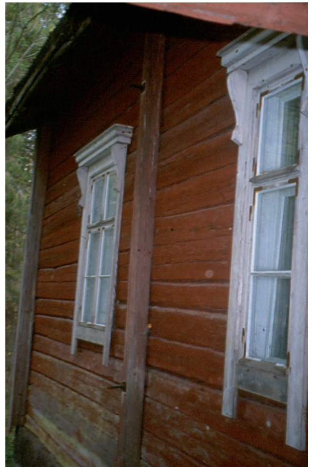
Kartanon pientenlasten koulun, Mykkälän koulun, pihanpuoleisia ikkunoita.

Muistitieto ei ole varmennettua tietoa. Ihmiset muistavat asioita ei näkökulmilta ja eri tavoin, ja muistelutilannekin vaikuttaa muistoihin. Oman elämän tapahtumia voidaan muistaa