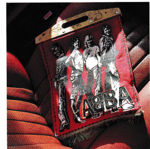
Lapsuuden idoleista muistuttava Abba-laukku löytyi kirpputorilta. Myös auton punaiset nahkapenkit heijastavat 1970-luvun estetiikkaa.