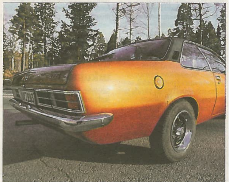
Saksalaisen virtaviivaista kauneutta 1970-luvulta.