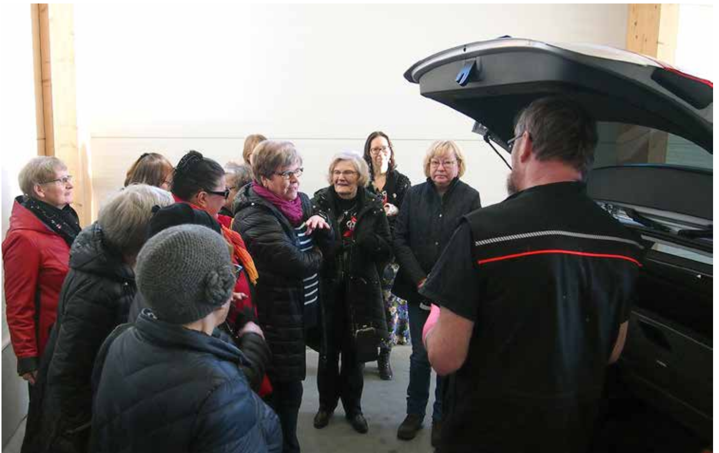
Esa Suomi esitteli auton tekniikkaa ja huoltoa, joista naisautoilijankin on hyvä tietää.