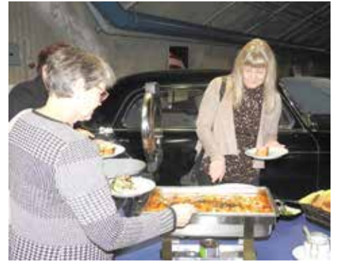
Ennen vuosikokousta NAK tarjosi hyvän lounaan.