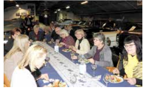
Vuosikokouksen ja teemailtapäivän puitteissa maan uumenissa, Mersu-klubilaisten klassikkoajoneuvojen keskellä.

on muualle. Mallin katsetta ei aina pyydetä kohdistamaan suoraan kameraan, vaan kasvoja on hyvä kuvata myös yläviistosta. Näin esimerkiksi 60-luvun meikki tulee parhaiten esiin. Liikekuvista onnistuu yleensä yksi kahdestakymmenestä niin, että kaikki kuvassa on kohdallaan.