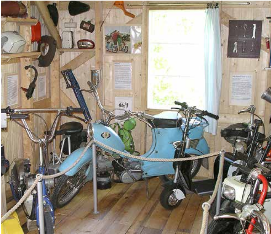
”Suomen pienimmässä mopomuseossa” isoilee minimopojen seassa ’58 Afa 2000 -mopo, joka on turkulaisen Oy A.F. Aaltosen maahantuoma pohjautuen Crescent 2000:een.