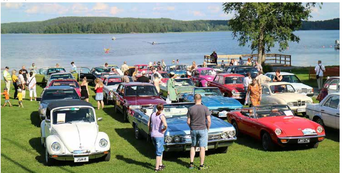
Pysäköinti Mobilian rantanurmikolle.