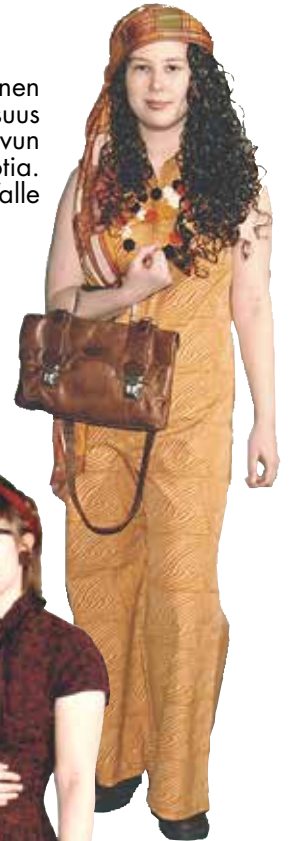
Näytöksen toinen asukokonaisuus esitteli 1970-luvun muotia.