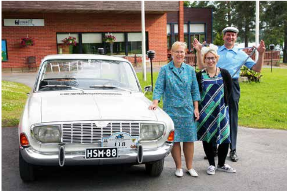
Reissaaminen museoautolla omien vanhempien kanssa on ihan hauskaa ajanvietettä. Tässä ollaan 1965 Ford Taunuksella Suur-Saimaan Ympäriajossa 2014.