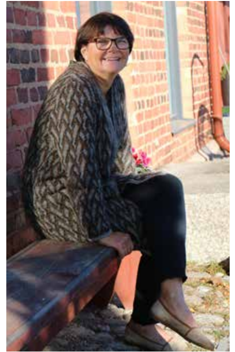
Makasiinin kunnostaminen kodiksi kesti neljä vuotta, mutta nyt on valmista ja on aikaa hetkeksi istahtaa. Piharakennusten parissa riittää toki vielä työtä.