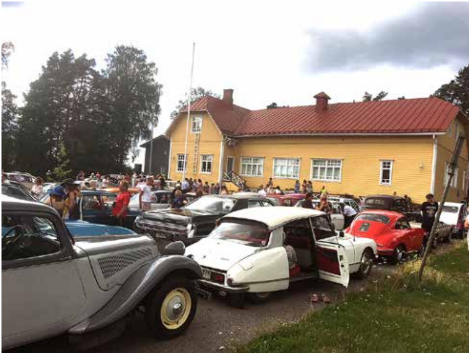
Pysäköinti Kagasalan Pirtin pihalle.