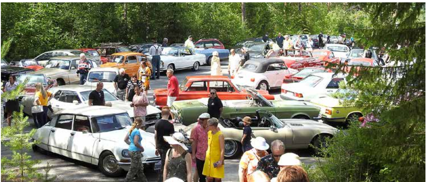
Kulttuuriperintöä molemmat, historialliset ajoneuvot ja Haralanharjun kulttuurimaisema.