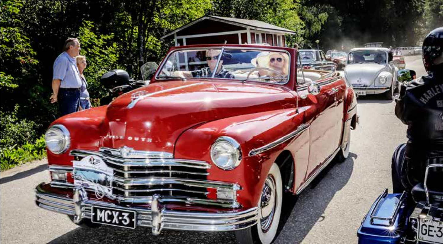
Vanhin ajoon osallistunut ajoneuvo Plymouth Convertible Club Coupe vm. 1949 lähtee reitille, kuljettajana Pia Haili.