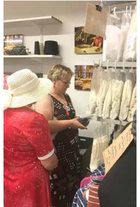
Tehtaanmyymälästä voitiin ostaa laadukkaita kotimaisia vaatteita sekä miehille että naisille. Äiti ja tytär Taivainen ostoksilla.