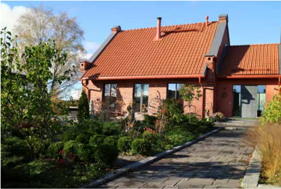
Viitaniemet ovat kunnostaneet ainutlaatuisen kodin Kirstulan Kartanon entiseen viljamakasiiniin.