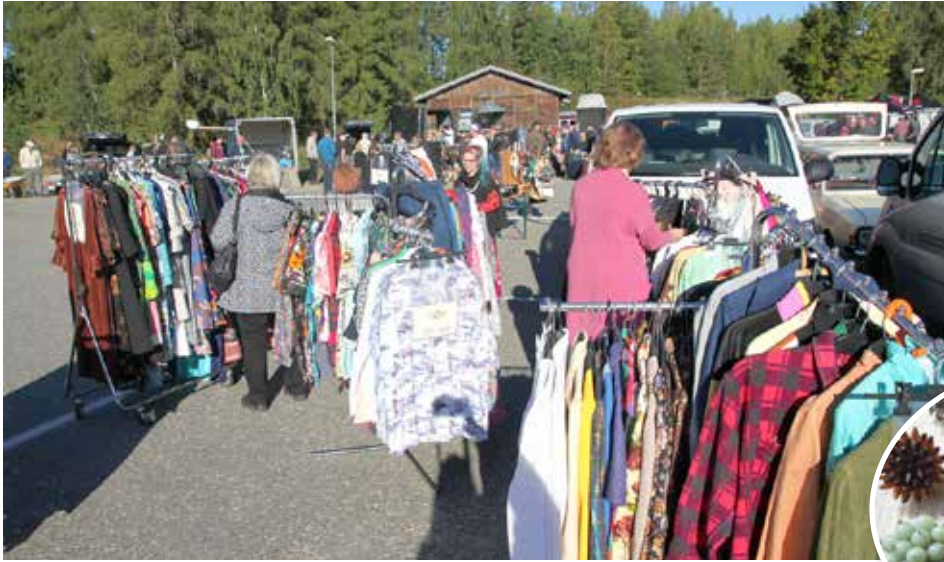
Viivin Vintagella oli myyntiosasto Tampereen Mobilistien Kangasalan Varaosa- ja Rompemarkkinoilla elokuussa.