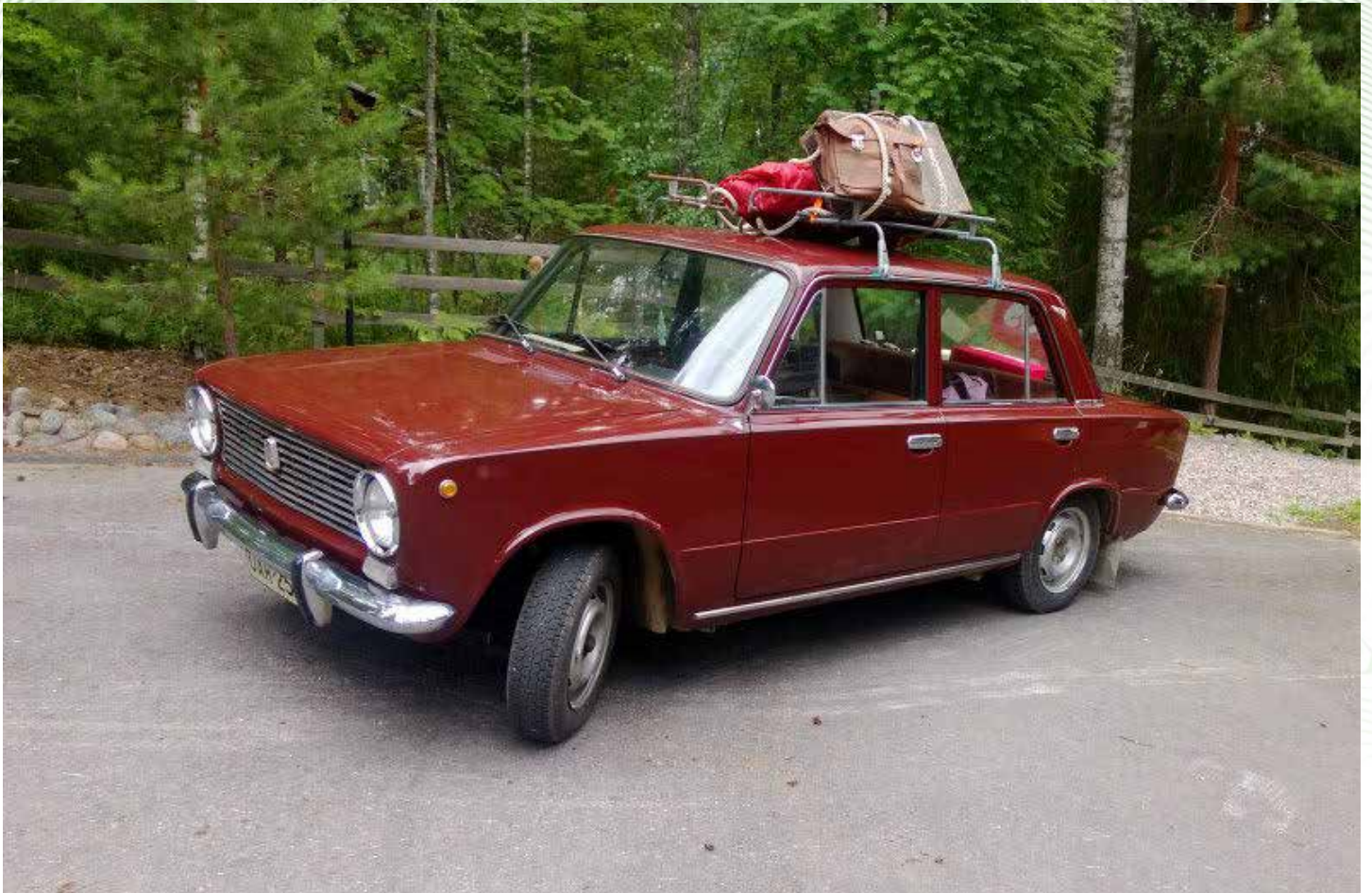
Lähtökuopissa, valmiina matkaan.

Perjantai koitti ja edessämme oli viiden viikon loma. Meillä oli suunnitelmat vielä tarkan aikataulun osalta auki, mutta emme stressanneet, sillä loma olisi pitkä, joten ennättäisimme kyllä. Olimme lauantaina veneilemässä Päijänteellä ja rantauduttuamme kotilaituriin aloin suunnitella laivamatkan varausta. Mieheni katsoi minua kuin hullua ja kysyi, että aionko oikeasti lähteä? Vastaukseni sai osakseen jonkinasteista kyräilyä ja kommentin, että tehdään varaus myöhemmin, sillä nettipankkitunnuksetkin ovat sisällä. Kaivoin lompakostani omat nettipankkitunnukset ja esitin maanantaille vaihtoehdot Tukholman lautoille.