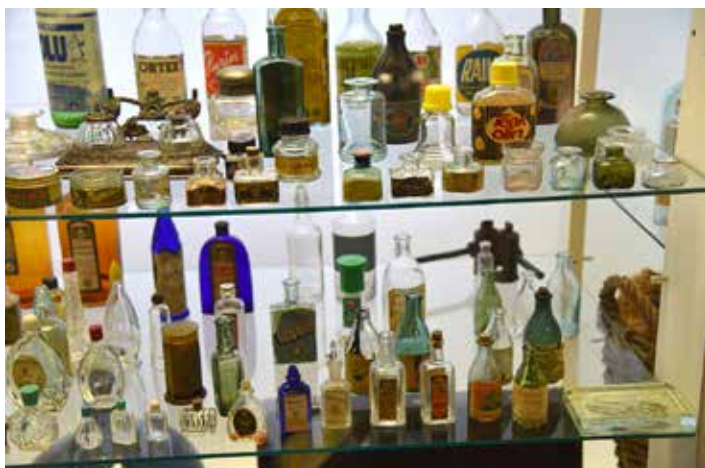
Erialaisten käyttötuotteiden vanhoja lasipakkauksia.