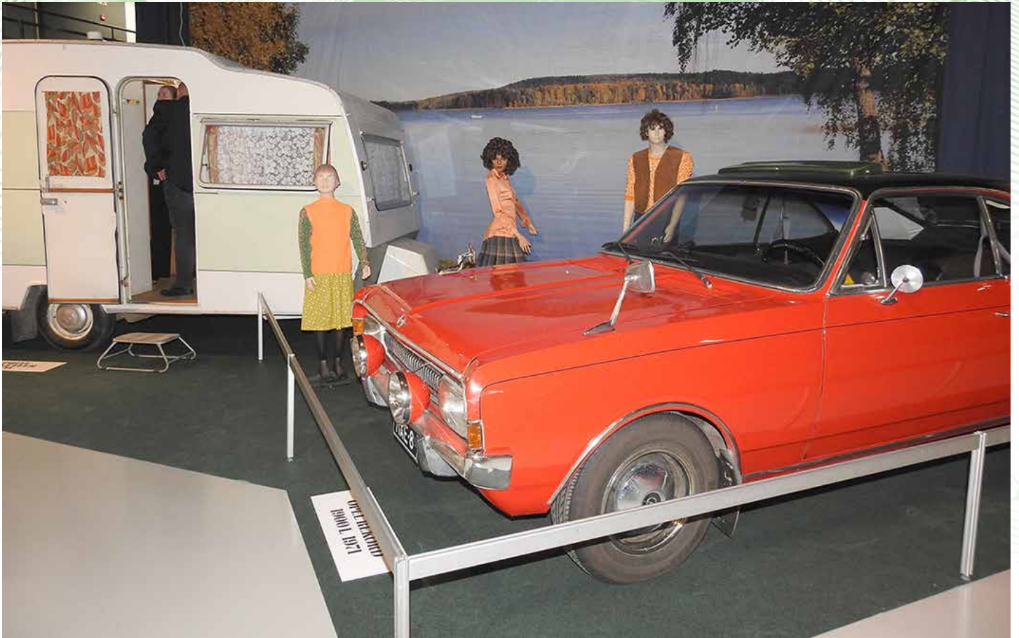
Asuntovaunu ja Opel Record 1900, 1971.