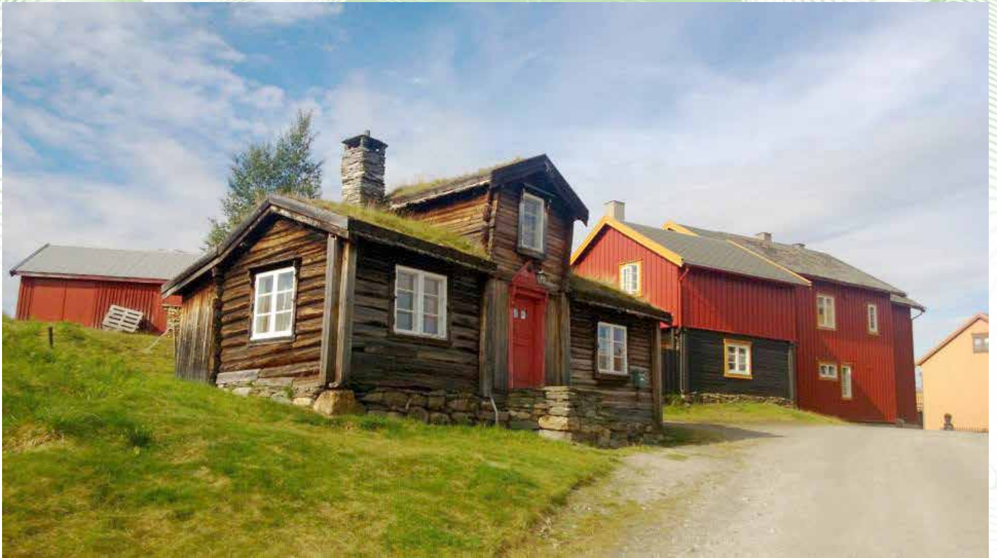
Ihastuttavia rakennuksia Rørosissa.