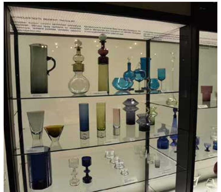
1950-60 -luvun design-lasia.