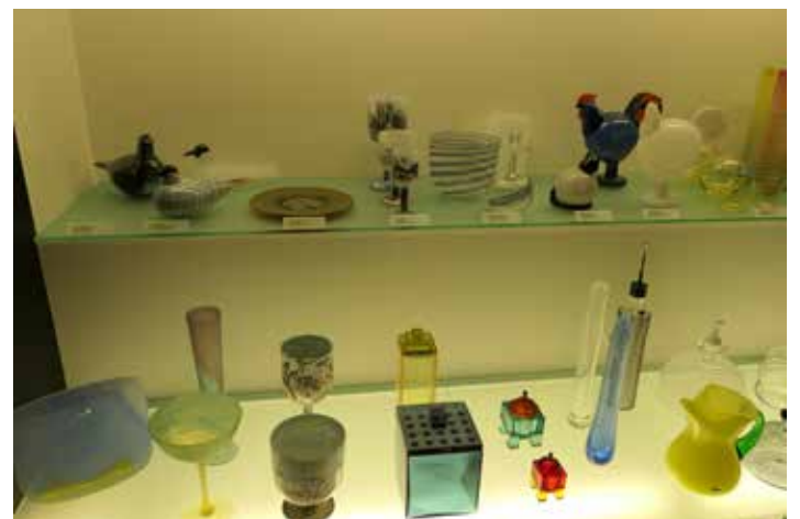
Lasitaidetta 1980-90 -luvuilta.

Perusnäyttelyn lisäksi lasimuseo esittelee vaihtuvissa näyttelyissä kansainvälistä ja kotimaista käyttö- ja taidelasia, lasitaiteen ja muotoilun huippuja sekä harvinaisia historiallisia kokoelmia eri puolilta maailmaa. Tutustuimme De forme del vetro -näyttelyyn, jossa oli esillä venetsialaista lasia 1900-luvun alusta. Tuleva kesänäyttely 10.5.-18.8.2019 vie katsojan