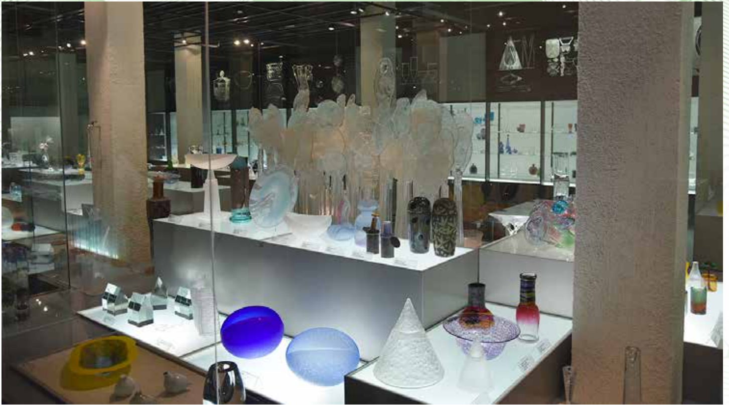
Design & taidelasi -osastolla on esillä tunnettujen suunnittelijoiden lasia 1900-luvun alusta alkaen. Vanhempien lasiesineiden suunnittelijoita ei tiedetty.