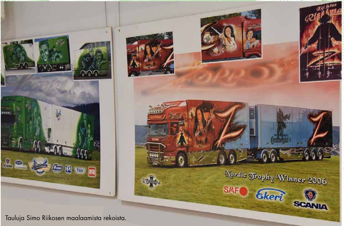
Tauluja Simo Riikosen maalaamista rekoista.