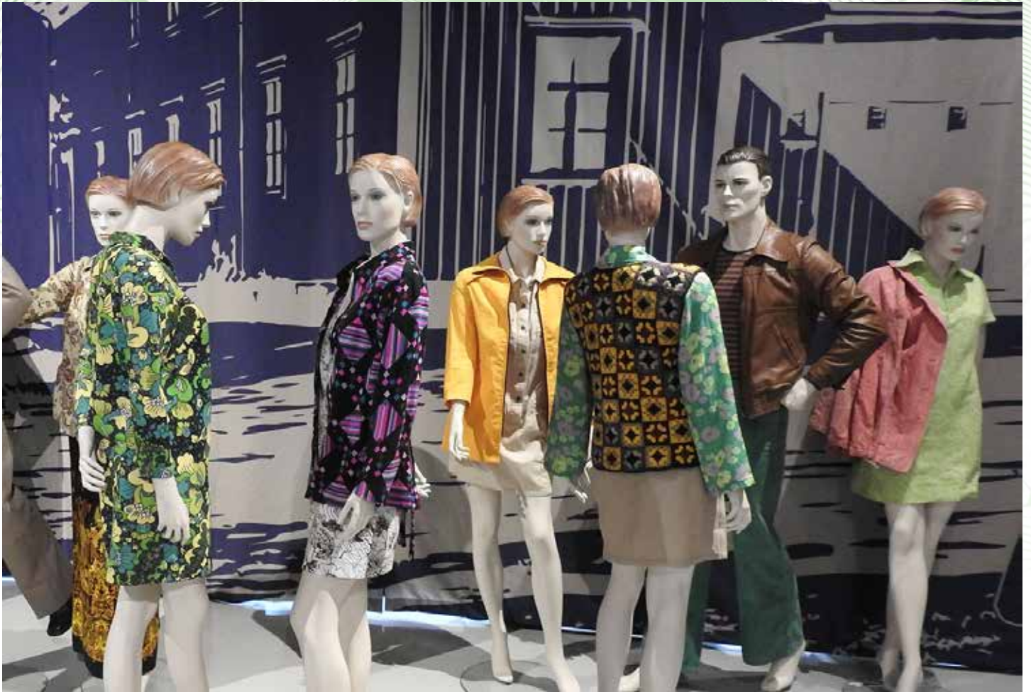
Mallinuket 70-luvun tyyliin tanssiapaikan edustalla.