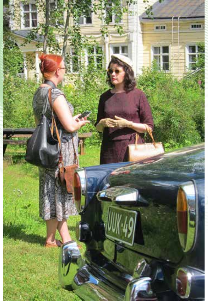
Haastatteluhetki NAK:n 10-vuotisjuhla-ajossa 2017.