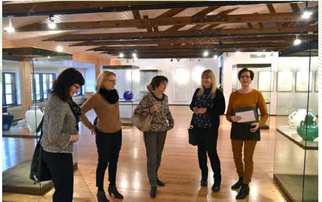
Näyttelyn antiin tyytyväisiä klubilaisia tutustumassa 1900-luvun alun venetsialaiseen lasiin museon vaihtuvassa näyttelyssä.

Oiva Toikan (1931-2019) yllätykselliseen ja värikkääseen mielikuvitusmaailmaan. Kannattaa käydä katsomassa.