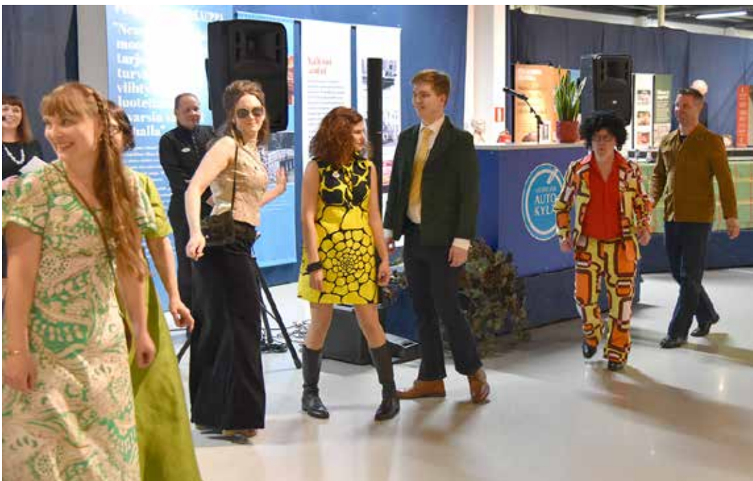
”Rytmiikkäät mannekiinit” arvioitavana.

(autokanta 88 0056 autoa) vuonna 1979 kuolleita oli 582, vaikka autoja liikenteessä oli lähes 450 000 enemmän. Nykyään tilanne on entisestään parantunut: vuonna 2017 liikenteessä oli yli neljä miljoonaa autoa ja liikenneonnettomuuksissa menehtyi 238 henkilöä.