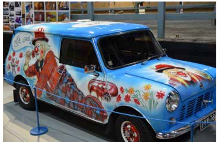
Simo Riikosen maalaama Mini.