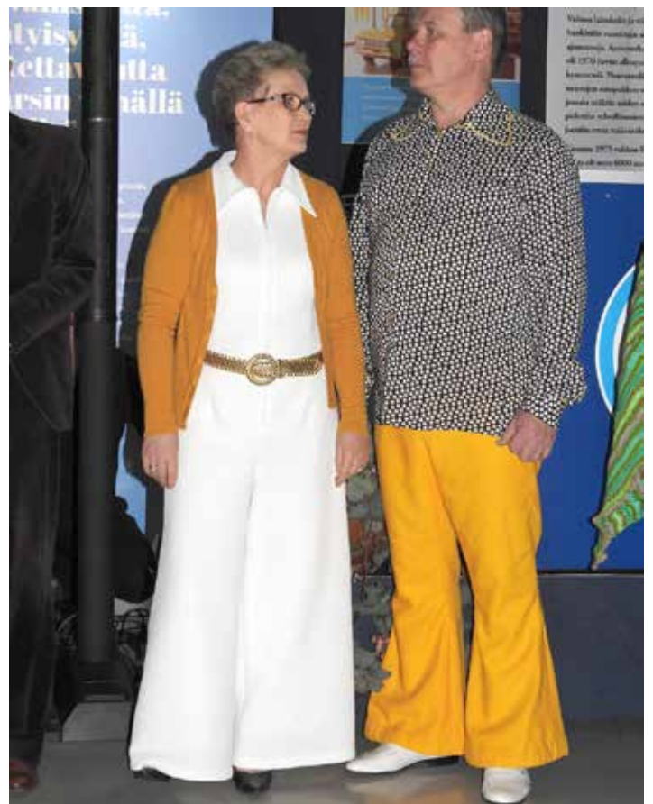
Mukavaa, että osa kutsuvieraista saapui teeman mukaan pukeutuneina. Asukilpailun voitti Lällän pariskunta.

Turvavyöt eivät matkalaisia turhaan kiristäneet, sillä etu-