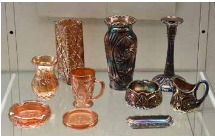
Riihimäen Lasitehtaan värikkäitä Hoh'to-Lustra -lasitavaroita mainossteffiin kohottamaan huoneen tai pöytäkaluston kokonaisvaikutusta sävyvivahteineen.