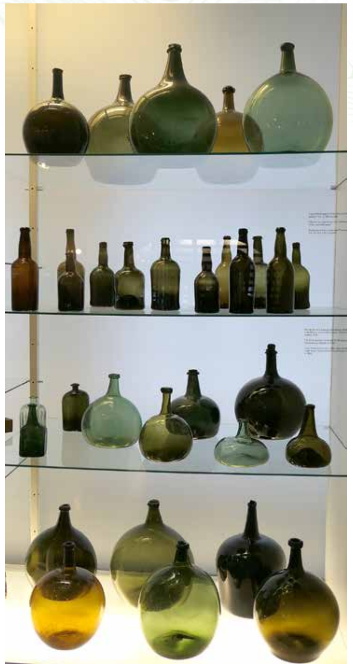
Tämä vitriini vangitsee katseen "Pullon tarina" -osastolla. Vanha lasi oli vihreää ja ruskeaa riippuen lasinvalmistukseen käytetyn hiekan rautapitoisuudesta. Rautaoksidin värjäys lasin vihreäksi. Pullot ovat uniikkeja.

Suomen lasimuseo on valtakunnallinen erikoismuseo. Sillä on myös käsikirjasto, joka on maan laajin erikoiskirjasto.