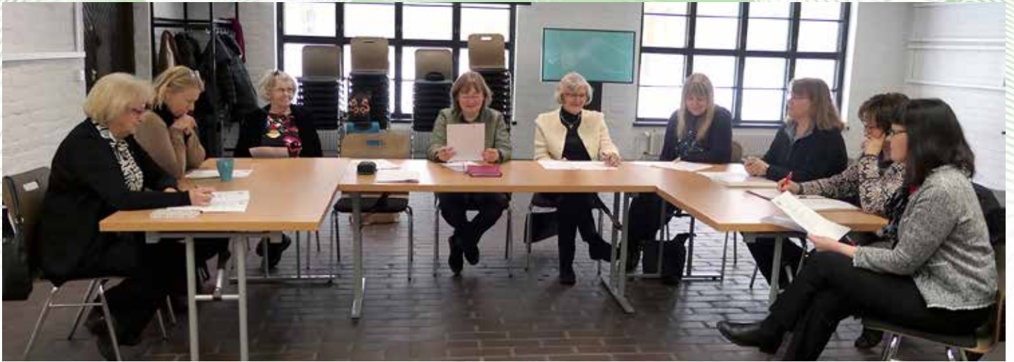
Ennen opastettua kiertokäyntiä pidettiin Naisten Autobiilklubin vuosikokous museon tiloissa.