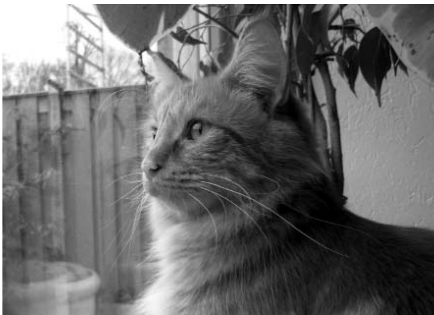
Norleon Sunna 2-vuotiaana