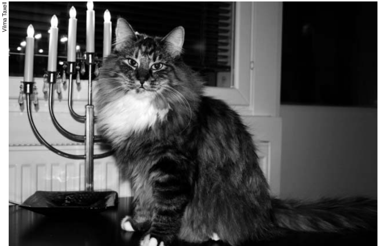
Norleon Destiny 9 kuukauden iässä.