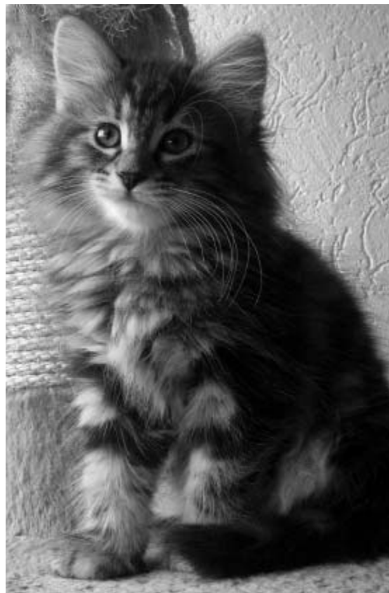
Sunnan ja Junior T van Yjovin nallekarhutyttö Inez van Yjovi (f 22).

Käydessäni Hollannissa kaikki Sunnan pennut olivat vielä kotia vaille, mutta muutaman viikon kuluttua kaikille oli jo löytynyt koti: Anouk muuttaa hollantilaisille kasvattajille, suosikkini Inez Belgiaan ja Angel ja Krissie hollantilaisen tv-tähden iloksi... Uusi matka Hollantiin on jo haaveissa, mutta saa nähdä milloin se toteutuu J.