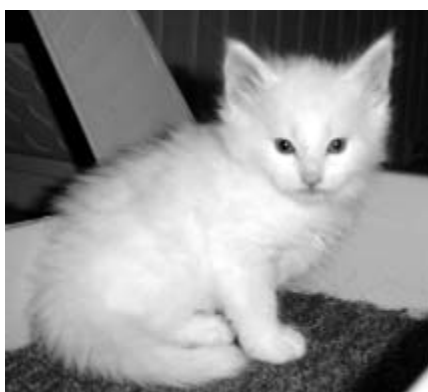
Pikku Wiltsu, 5 viikkoa.