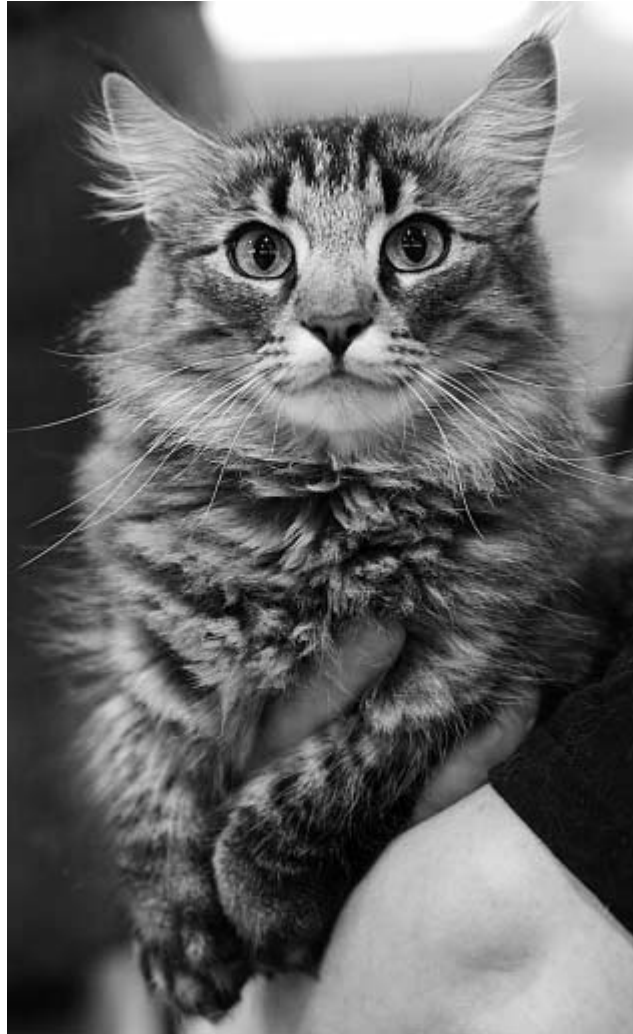
CH Spot-On Hedvig [NFO n 23].