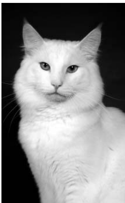
Wiltsu aikuisena, painoa kahdeksan kiloa.