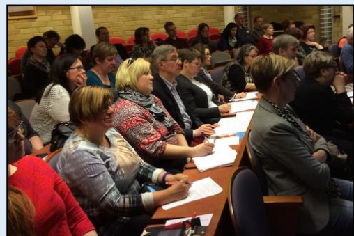
Alueyhdistyksen vuosikokous järjestettiin Härmän Kylpylässä 23.4.2015.