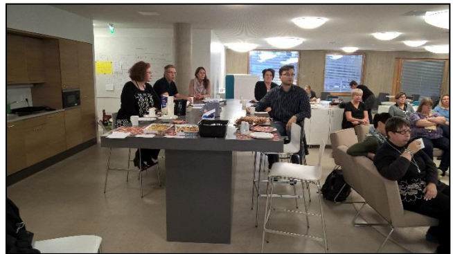
Yhteysopettajakoulutus Isonkylän monitoimitalossa.