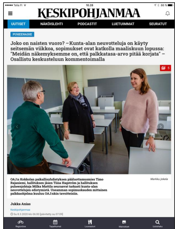
Palkkaneuvottelut mediassa 8.3.2020