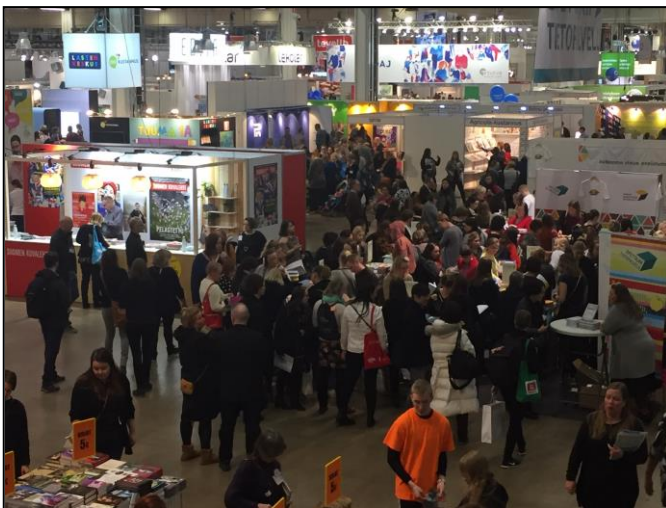
Educa-tapahtuma 25.1.2020