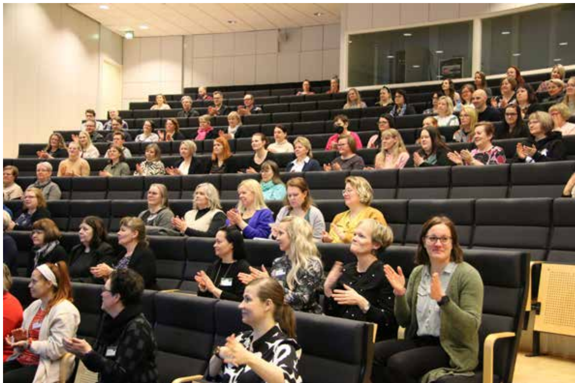
Luokanopettajapäivien esiintyvät saivat yleisöltä runsaat aplodit.