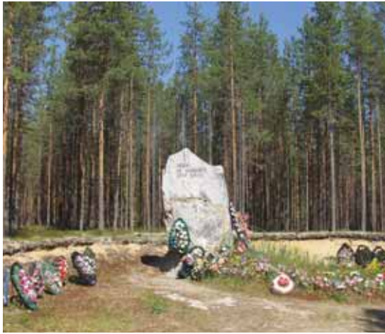
Sandarmoh – "Ihmiset älkää tappako toisianne". 7000 tapettiin täällä jonkun asian takia.

Otsikko on hakattu kiveen Sandarmohin teloituspaikan muistomerkkiin Karhumäessä. Sandarmohin alueelle on haudattu 7000 Stalinin vainoissa (1936–38) tapettua ihmistä. Joukossa on paljon suomalaisia.