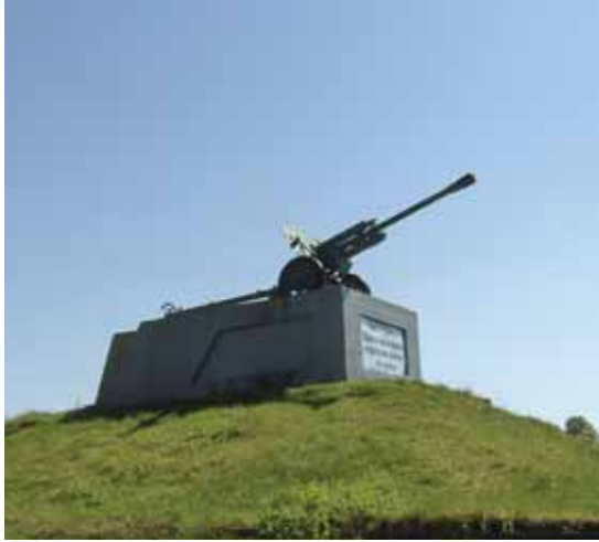
Povensan tykki vartioi Stalinin kanavan siltaa

Tämän jälkeen saavuttiin sitten Povensan pikukylään. Sinne Stalinin kanavan varteen pysähtyi suomalaisten hyökkäys vuoden 1941 lopussa, kun venäläiset avasivat kanavan sulut ja hyökkäyskärki jäi tulva-aallon alle. Kenttätykki vartioi kanavan siltaa putki suunnattuna länteen. Kanava rakennettiin