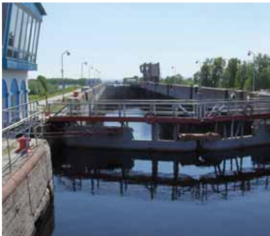
Stalinin kanava yhdistää Äänisen Vienenmereen

Sandarmoh ja moni muu paikka tuli tutuksi, kun joukko Pohjanmaan opettajia ja muita asiasta kiinnostuneita kävi 6.6.–10.6. Poventsassa Stalinin