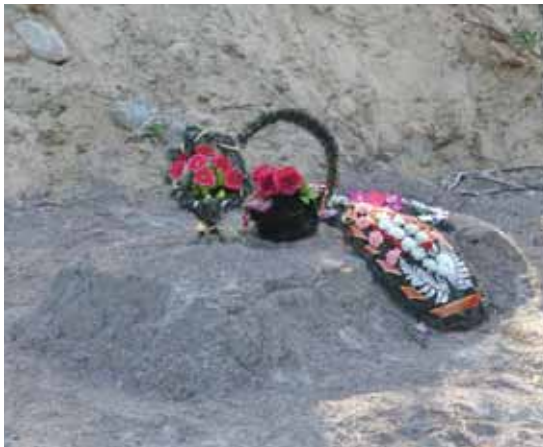
Kollaalla löydetyn venäläisen taistelijan tuore hauta

Illan suussa palattiin Petroskoihin, jossa tuli ensimmäinen ja ainoa ikävä yllätys. Linja-automme hajosi keskelle kaupunkia. Yksi pieni liitin särkyi, auton paineet katosivat ja matka loppui siihen. Hätäliitännällä ja miliisin avulla pääsimme kahden pysähdyksen