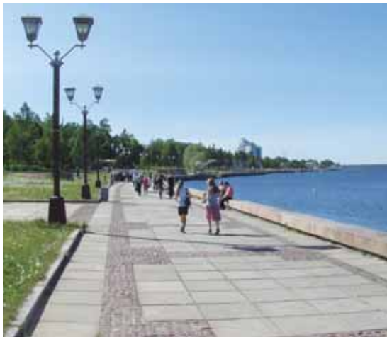
Petroskoin rantabulevardi on upea paikka

Petroskoihin saavuttiin hyvissä ajoin ja saimme erinomaisen tietopaketin karjalankieltä puhuvalta kaupunkioppaaltamme. Yllätyksen tarjosi vanha nuhjuinen Karelia-hotelli, joka oli uusinut kasvonsa