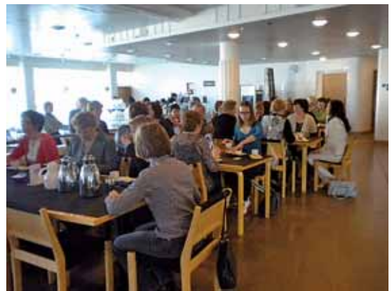
Luentojen jälkeen lähdettiin teatteriin katselemaan ja kuuntelemaan ”Naisen ääni”-esitystä. Tässä lastentarhanopettajia väliajalla.