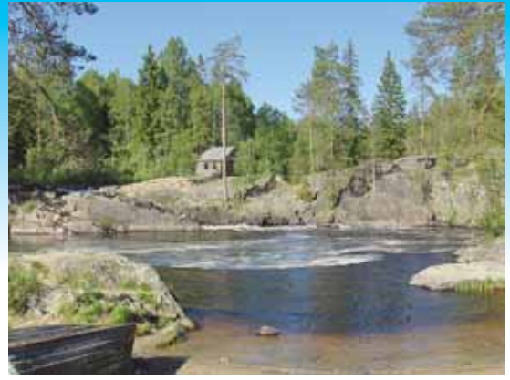
Abinkoski Ruskealassa oli monen elokuvan kuvauspaikka 1930-luvulla

taktiikalla viiden kilometrin matkan viidessä tunnissa hotelliin. Venäläinen miliisipäällikkö oli mainio herra. Hymyä ja huumoria riitti ja hänen luvallaan tiellämme ollut pysäköity Audi meni, että heilahti tien poskeen. Aamulla Volvon huolto hoiti automme kuntoon.