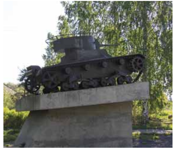
T-26 Pitkärannan länsilaidalla. Tällä alueella käytiin kovia taisteluja sekä 1939 että 1944

kanavalla. Alku ja loppu matkasta noudattelivat paikkoja, joissa Tuntematon Sotilas (JR 8) taisteli. Mielenkiintoisten paikkojen lisäksi matkalaiset tutustuivat venäläiseen ympäristön hoitoon ekopisteiden avulla. Tapansa mukaan Äiti-Venäjä järjesti matkalaisille monenlaisia yllätyksiä mutta onneksi yleensä miellyttäviä. Sää suosivat matkalaisia eikä lämpötila noussut Venäjällä yli 26 asteen.