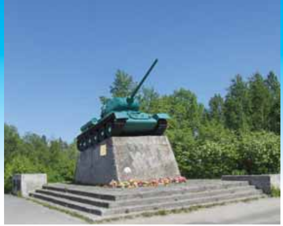
T-34 eli Sotka turvaa Karhumäen keskustaa

Kolmantena matkapäivänä lähdettiin Stalinin kanavalle. Matkalla pistäydettiin Kivatsun luonnon-