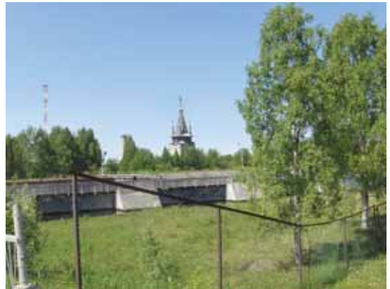
Poventsan kirkko on kymmenen metriä Stalinin kanavan pintaa alempana

suojelualueen putouksilla, joiden korkeus on 10,2 m. Sitten auton keula suunnattiin Karhumäkeen, jonka keskustaa vartioi korokkeelle nostettu T-34/85 panssarivaunu. Petroskoin jälkeen kaupunki tuntui pysähtyneeltä ja ankealta paikalta ja siellä tuli esiin Venäjän nurjempi puoli. Asemarakennus on rakennettu ennen sotia ja on hyvässä kunnossa. Suomalaisten hyökkäyksen piti pysähtyä tänne 1941 lopussa. Karhumäen valtauksen jälkeen venäläisillä ei ollut alueella enää joukkoja, joten etenemistä jatkettiin Poventsaan Stalinin kanavalle. Asemasodan aikana Karhumäen kallioille rakennettiin valtavat linnoituslaitteet, jotka luovutettiin ilman taistelua kesällä 1944.