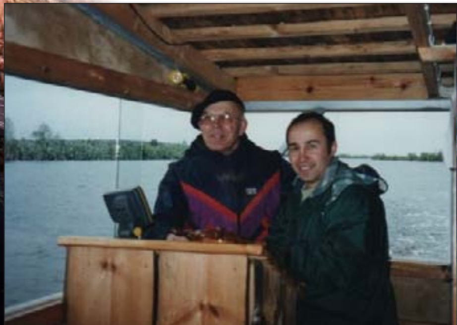
Joki virtaa vielä länteen.

100.000 years ago here was nothing but ice, some two kilometres. Because of the heavy weight of ice, the surface of the earth sunk down, several hundred meters. About 10.000 years ago became warmer. The ice melted down and you could find a big lake. There was not any ground or soil, but then somebody was rowing with just similar vehicle like this "Kaisa", and found a little bit of land, and cried: find land. So the first human people, the first aliens decided to call this country in the middle of nothing FINLAND. The ground rose up and it is still rising one centimeter per year. But in the interior of the land there was still a big lake. And this very river, which along you are skiing/rowing/sailing - was the main river of Finland. Almost all rain water in Finland run out to the Atlantic Ocean just via this river.