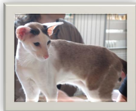
CH Sultsinan Kriek Boon, JW