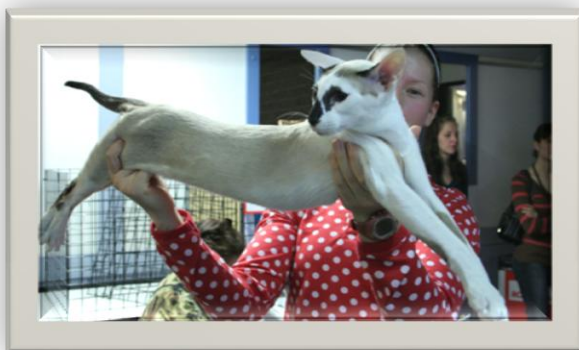
Sultsinan Malheur Dark