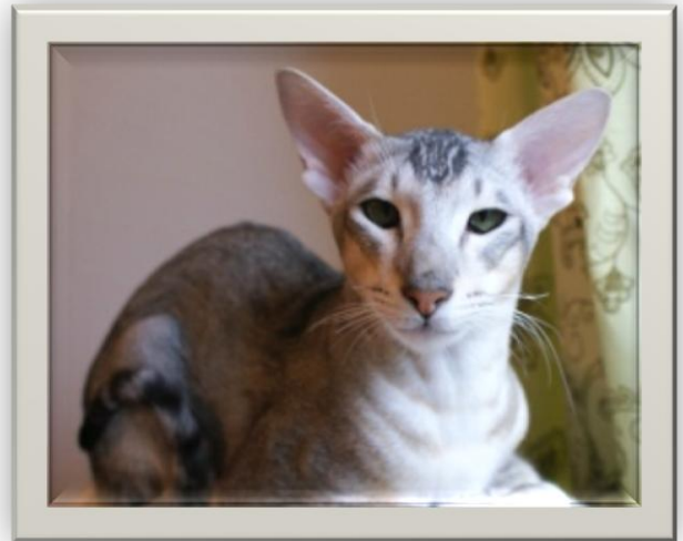
CH Taffalval Garik

http://kotisivu.dnainternet.net/mikbrygg/