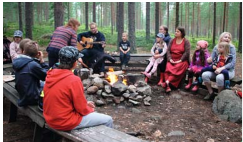
Leirinuotio on perinteinen osa leirielämää.

Osoite: Puroniemen leirikeskus, Kerkonkoskentie 608, 77700 Rautalampi Lisätietoa Puroniemestä: www.puroniemi.net