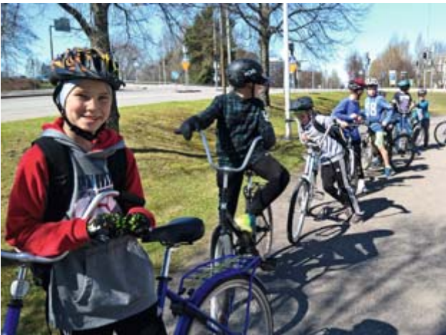
Kesäleiri antaa monelle lapselle koko elämän kestävä muistot.