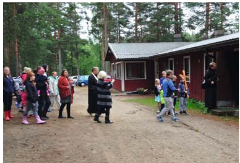
Leiriläiset osallistuivat leiripaikkojen siunaukseen.