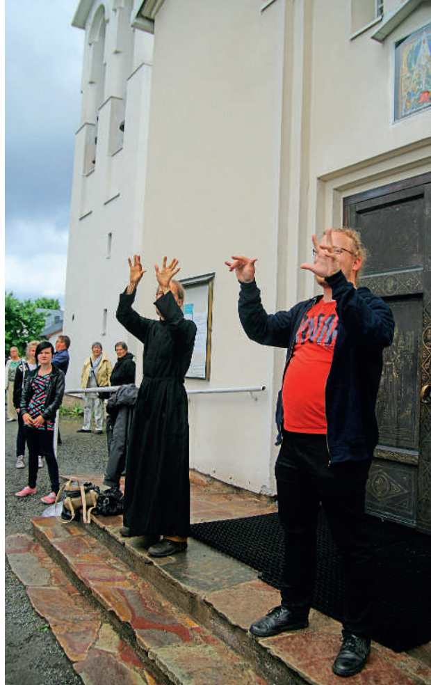
Päivän peleissä päästiin mukaan leikin riemuun.

siseen uskontoon sekä uusiin ortodoksiin kavereihin ympäri Suomea. Ystävyyksiä syntyi yli seurakunta- ja maakuntarajojen. Sama pätee myös ohjaajiin, joista osa on usein edellisen kesän leiriläisiä. Tässä onkin ONL:n kripareiden perinteinen vahvuus.