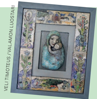
VELI TIMOTEUS / VALAMON LUOSTARI

Taiteilijan puoliso Unto Lintu on valmistanut teosten jalustat, taustat ja ke-