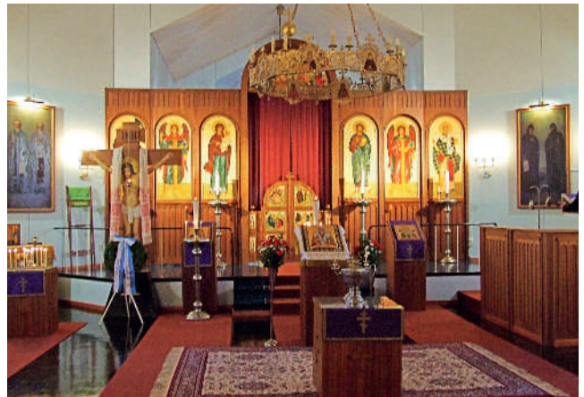
Rautalammin kirkon kirkkosali.