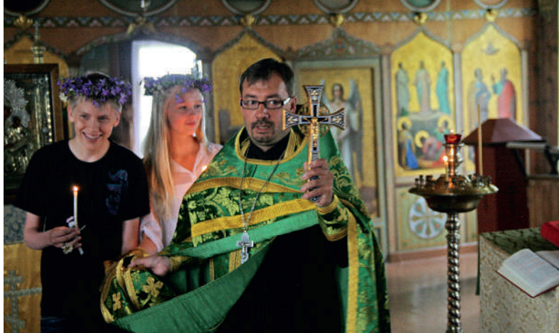
Leirin opetuksiin kuului mm. "avioliittodemo".