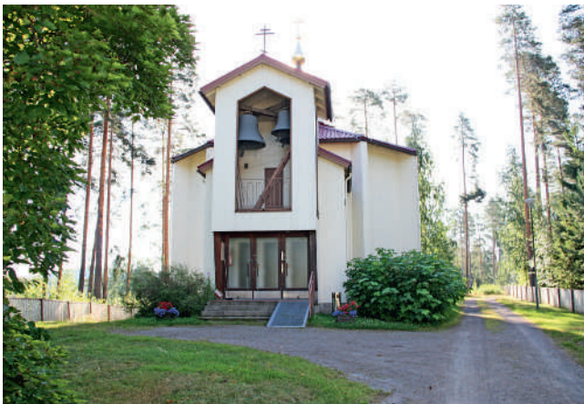
Pyhän Nikolaoksen kirkko.