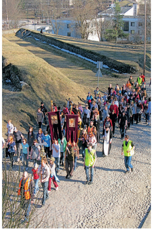
KUVAT: JASO PÖSSI