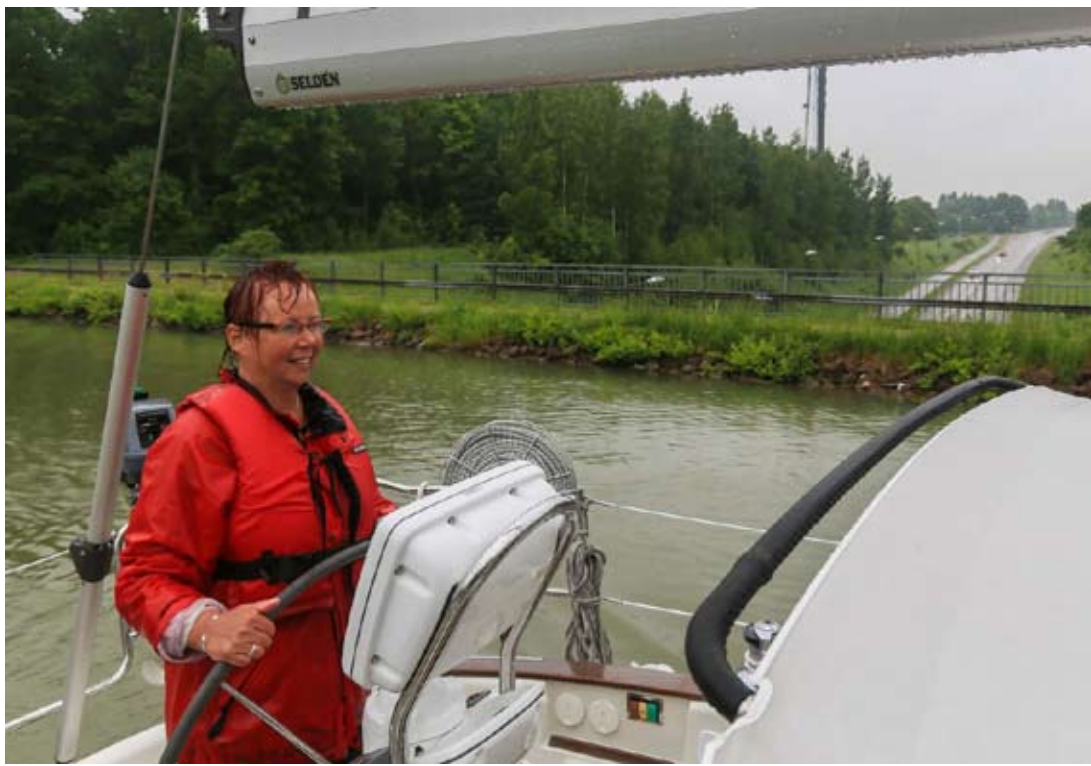
Autotien päältä on mukava huristella vaikka sataakin