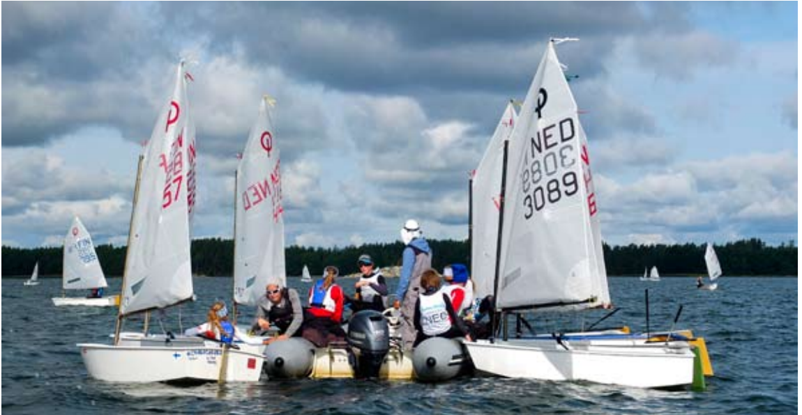
STO:n huoltotauko Optarien SM-kisoissa Ruissalossa