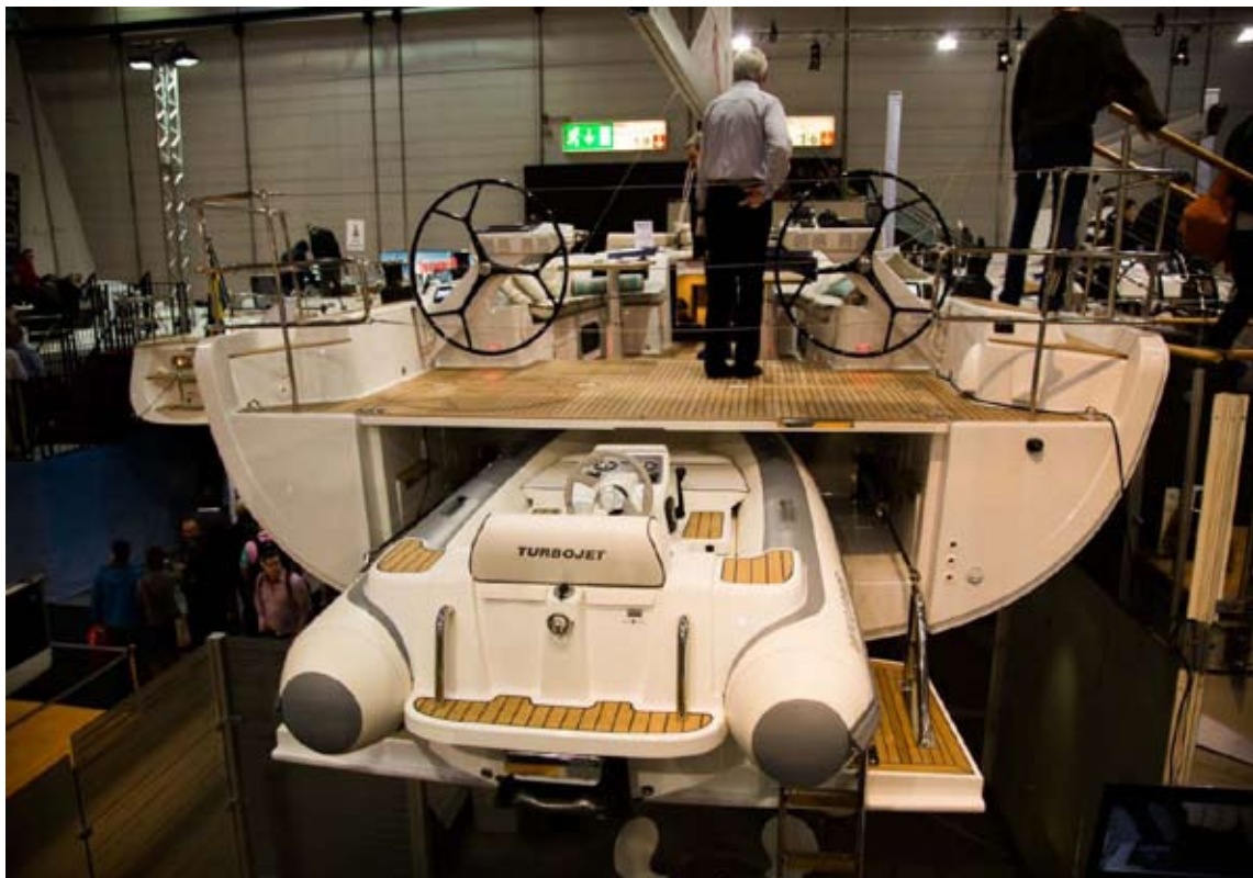
Avotilan alle mahtuva turbojetti on kätevä kauppakassina.