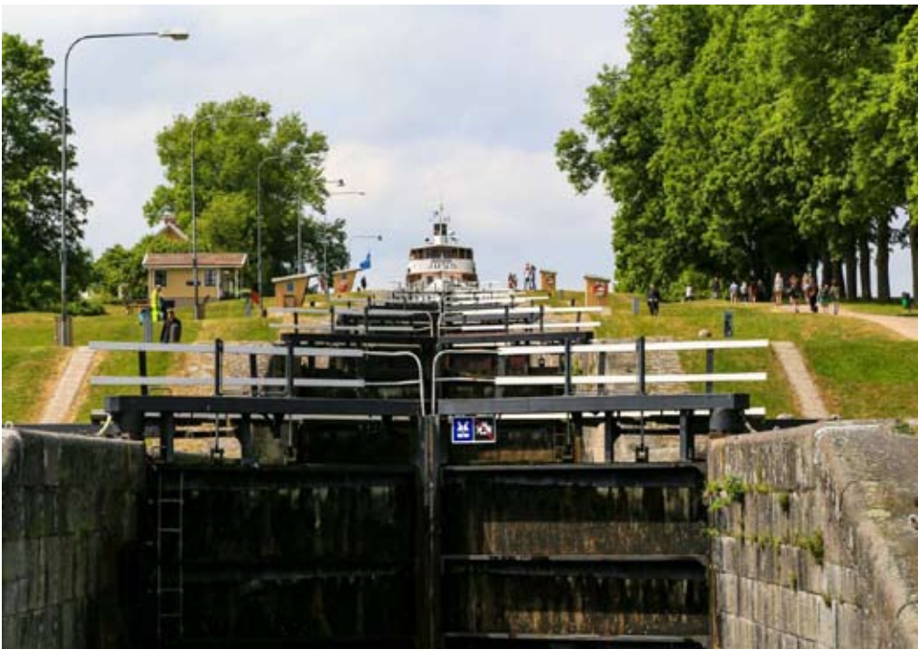
Bergin seitsemän sulun portaat kuuluvat Ruotsin suosituimpiin matkailunähtävyyksiin

Parin päivän markkinahulinan jälkeen irrotimme köydet ja suuntasimme juotavan kirkasvetiselle Vätternille. Pitkästä aikaa saimme nostaa purjeet ja kyseessä olikin ensimmäinen purjehduksemme makeassa vedessä, jos ei satunnaisia Hietasaaren lähestymisiä Oulujoessa lasketa mukaan. Päätimme poiketa varsinaiselta kanavareitiltä ja suuntasimme Vätternin itärantaa etelään päin. Kymmenkunta mailia purjehdittuamme saavuimme Vadstenan pikkukaupunkiin, jossa sijaitsevat Vadstenan linna ja luostari. Vierassatama linnan vallihaudassa on upeimpia näkemistämme