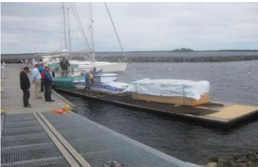
Puutavaralasti tuli ponttonilaiturin kyödyssä Praavasta.