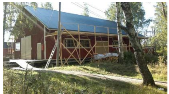
Uusi peltikatto hohtaa puhtautta.

Uudet talkoot alkavat heti toukokuun lopulla sähköpylväiden kalustamisella sekä kesäkeittiön perustuksen viimeistelyllä. 7.6. viikonloppuna saareen tulee koko rakennuksen hirsipaketti sekä suuri traktori/kaivuri joka laittaa sähköpylväät pystyyn asentajia varten. Talkoolaisia tarvitaan runsaasti kantamaan hirret lautan päältä kohteeseen, jossa ammattimiehet neuvoo mihin hirsi laitetaan. Toivotaan vaan runsaasti porukkaa ja sieviä ilmoja tapahtumille.