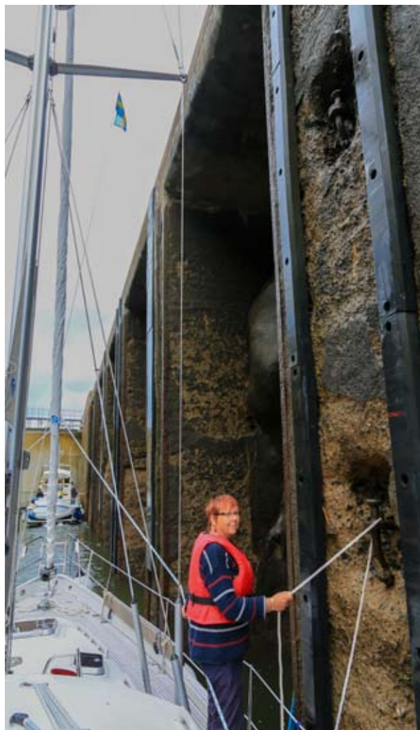
Väärällä puolella Trollhättanin kanavassa

Iltasella saavuimme Trollhättanin kaupunkiin ja viihtyisään vierassatamaan. Teollisuuskaupungin maineestaan huolimatta kaupunki osoittautui mukavaksi paikaksi, jossa oli nähtävää useammaksi päiväksi. Vanha monipor-