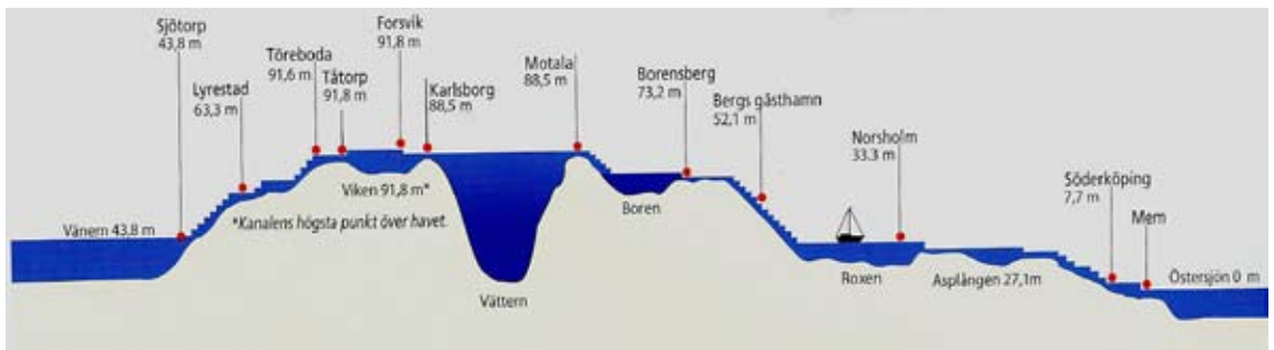
Kanavakartta Itämereltä Vänernille

Göta-kanava on rakennettu vuosina 1810 - 1832 ja se on edelleen Ruotsin kaikkien aikojen suurin rakennusprojekti. 1800-luvulla kanavalla oli tärkeä merkitys Ruotsin kehitykselle ja teollistumiselle. 1900-luvulla liikenne siirtyi vähitellen pyörien päälle, ja nykyisin kanavaa käyttävät pelkästään huviveneilijät sekä turisteja kuljettavat matkustajalaitat. Kanavaa oli lapiopelillä kaivamassa 60 000 miestä. Onneksi vain puolet 190 km:n kokonaismatkasta tarvitsi kaivaa, kun reitillä hyödynnettiin olemassa olevia järviä ja jokia. Kanavassa on 58 sulkua ja 46 avattavaa siltaa. Minimisyvyys keskellä on 2,8 m. Kanava on päivittäin auki klo 9 – 18. Lähes joka sululla on alkuperäinen kanavanvartijan mökki. Monet niistä näyttivät olevan yksityiskäytössä, mutta kaikki suojelukohteina hienosti kunnostettuja runsaine kukkaistutuksineen.