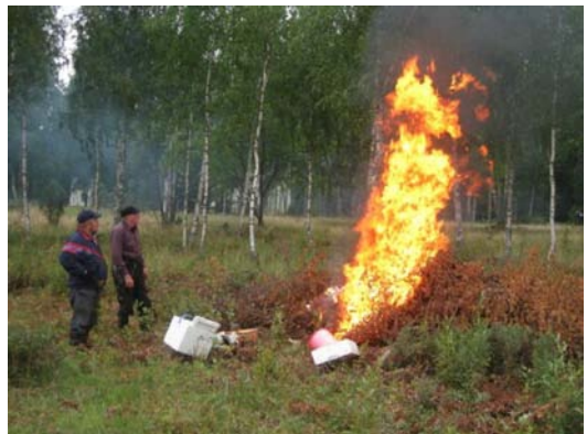
Saaren pyromaanit lempipuhissaan.