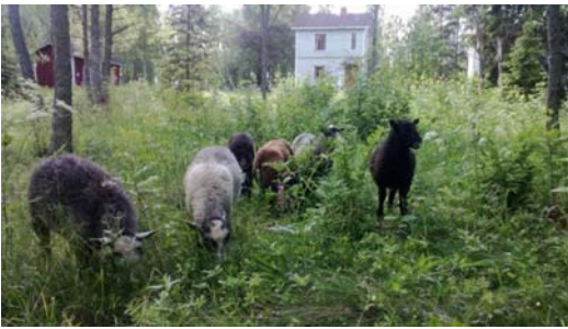
Saareen tuotiin seitsemän ruohonleikkuripässiä hoitamaan maastoa. Puhdasta tuli.