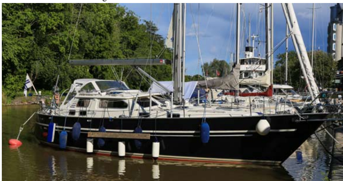
”Fendra ordentligt” sanottiin ohjeissa

Maksoimme satamamaksun ja saimme sulkuvahdilta viime hetken ohjeet rohkaisevan kannustuksen kera: ”Ta det bara lungt”.