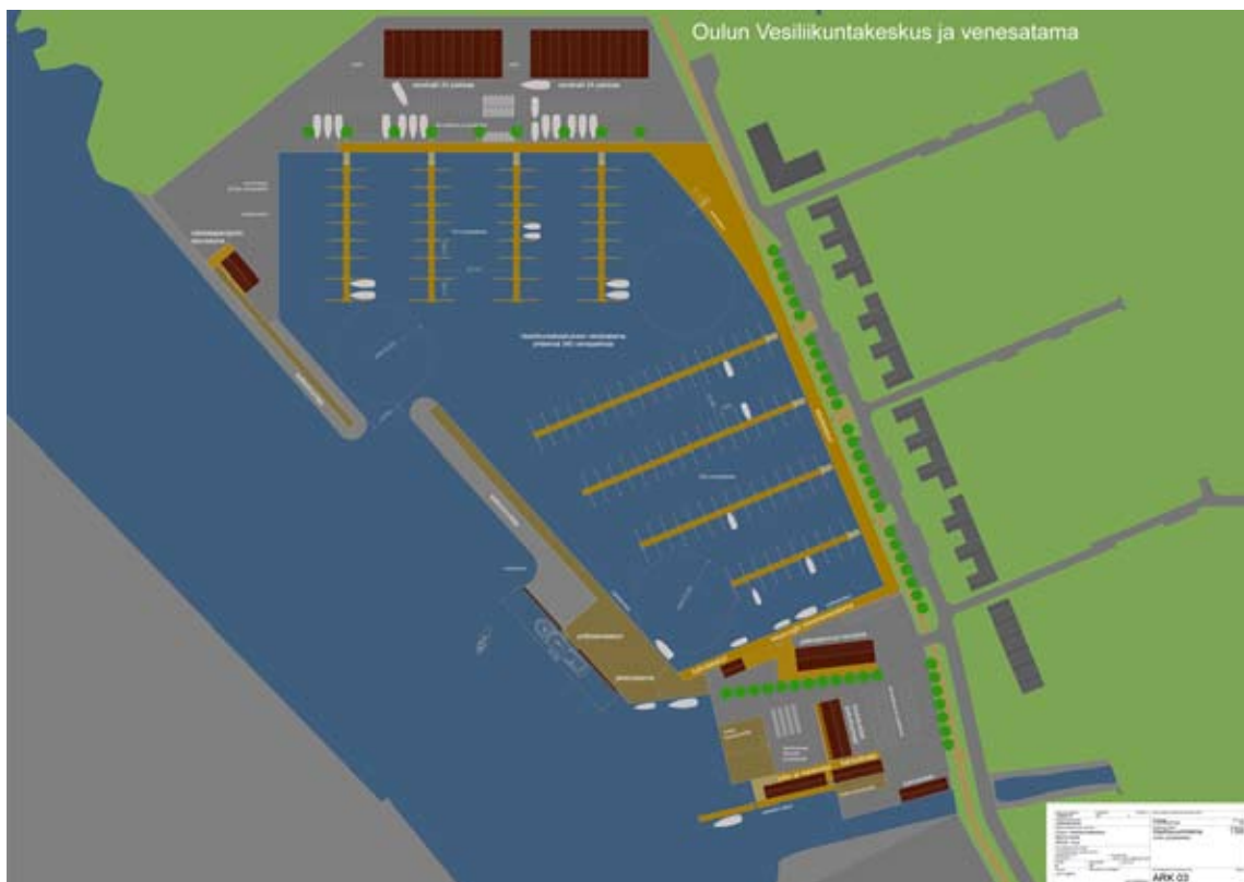
Toppilan uusi pienvenesatama. Etualalla Vesiliikuntakeskus

Valitettavasti asemakaava ei edennytkään vahvistettavaksi toivotussa aikataulussa. Pohjois-Pohjanmaan ELY-keskus käynnisti kesken kaavoitusprosessin Ympäristövaikutusten arviointimenettelyn Toppilan lämpövoimalan korvaajaksi suunnitellun uuden voimalan osalta. Hanketta suunnitellaan joko Toppilaan Oulun Energian voimalaitosalueelle tai Laanilaan Kemiran Oulun tehtaiden alueelle.