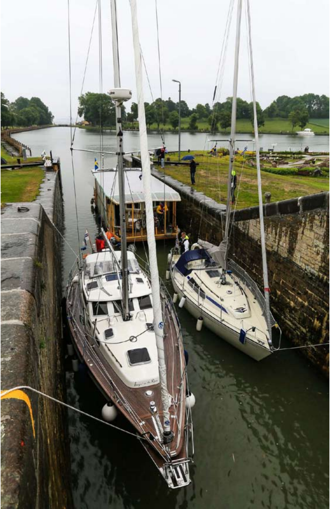
Kesäkuun suurin ruuhka – samassa sulussa oululainen ja turkulainen purjvene sekä ruotsalainen sauna.