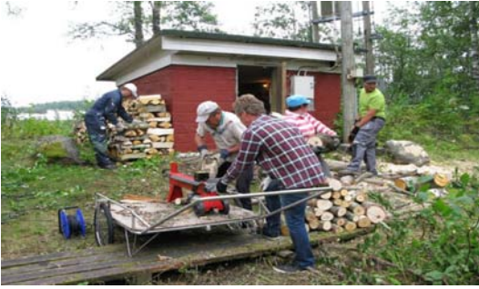
Välillä tehtiin grillipuitakin kuivumaan.