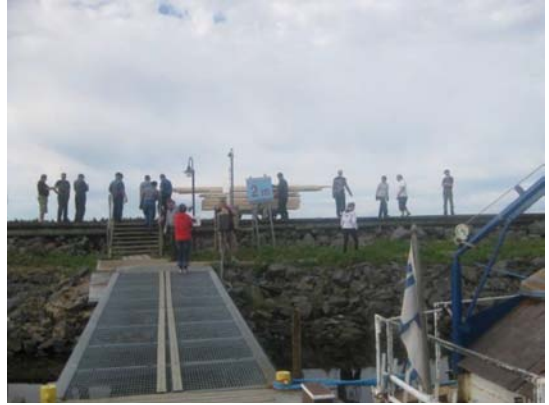
Vaunu oli tarpeen kuorman viemisessä rantaan.