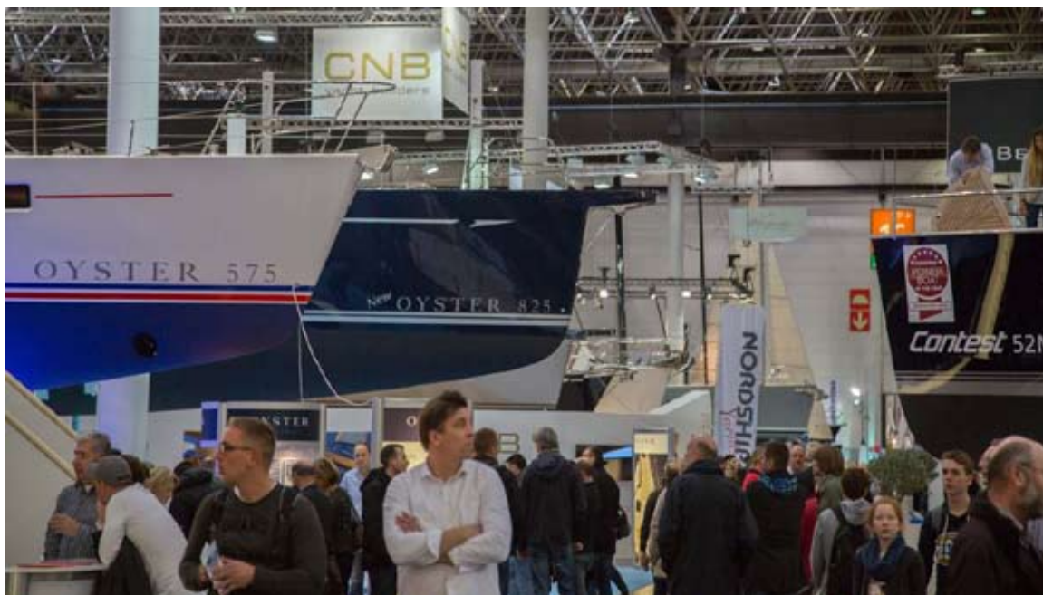
82-jalkainen Oyster oli "pikkuvenehallin" suurin