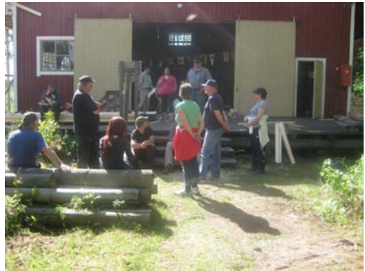
Tauko paikalla ja vatsat täynnä.