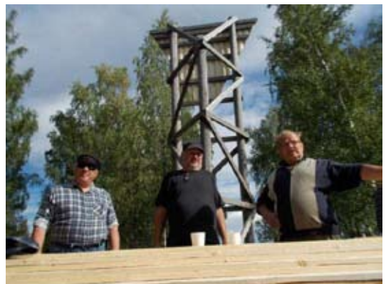
Kolme tukevaa työnjohtajaa seuraa tilannetta.