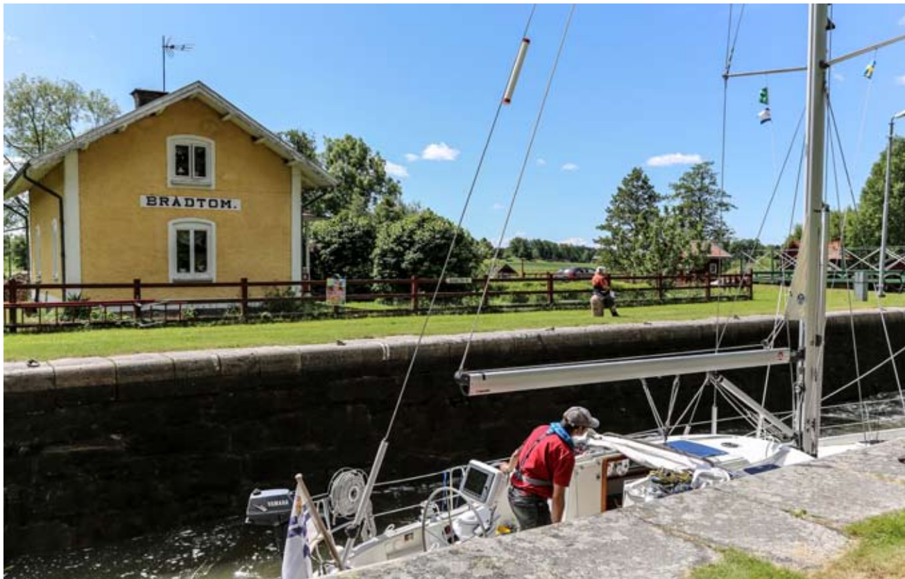
Sulkumiljööt ovat hyvin hoidettuja