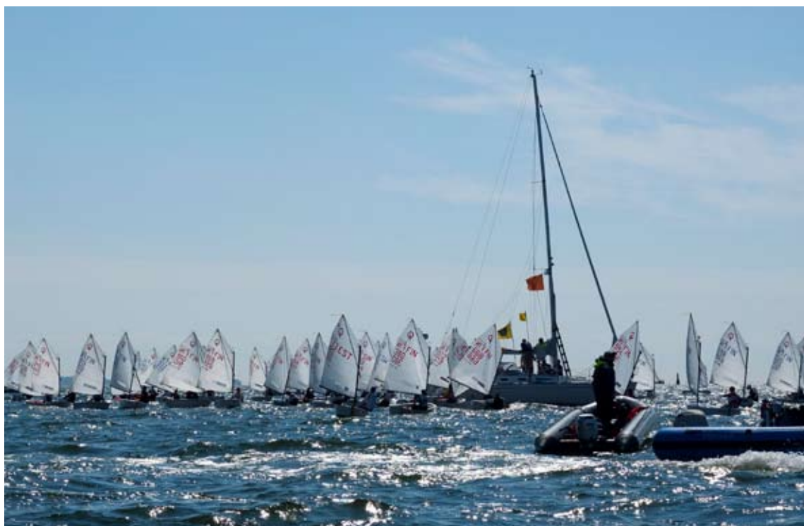
Optariranking-kisojen lähtötunnelmaa HSS:n DownTownRacessa kesäkuussa 2013

Kilpailujärjestelyt ovat suuresta osanottajamäärästä johtuen työläät ja vaativat. STO vastaa maaorganisaatiosta ja RTO hoitaa kilpailujen järjestämisen vesillä. Vapaaehtoisia kaivataan tietenkin kisajärjestelyihin sekä vesille että maihin.