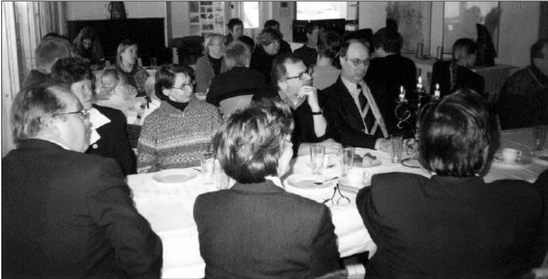
Päätöksiä 120-vuotisjuhlakokouksessa teki nelisenkymmentä opsilaisista.

Oulun Purjehdusseuran 120-vuotisjuhlakokous 18.3. Johteenpookissa oli yleisömenestys. Osanottajia oli nelisenkymmentä. Kokouksen päätteeksi tarjottiin maittava lohikeitto. Hallitus päätyi pohdiskelemaan, että aivan ilmeisesti ruokailu kannattaisi järjestää vuosikokouksen yhteydessä vastedeskin, jos sillä voitaisiin taata näin innokas osanotto.