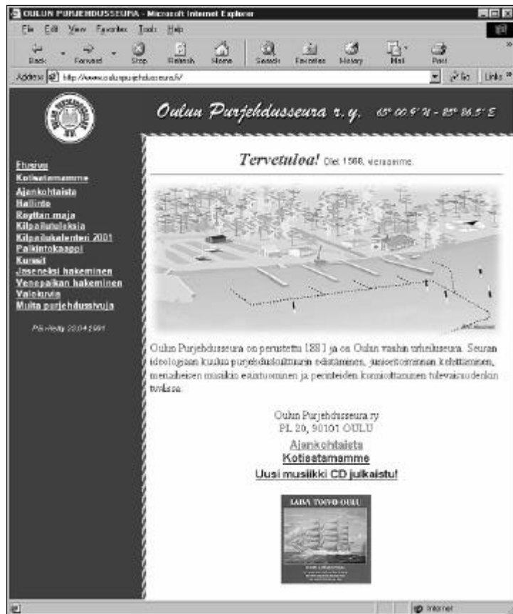
OPS:n kotisivu Internetissä; http://www.ouluapurjehdusseura.fi

Seuran Internet- eli kotisivut löytyvät osoitteesta www.ouluapurjehdusseura.fi . Sivuilla on sekä pitkäaikaista että ajankohtaista informaatiota. Sieltä löytyy mm. ajankohtaiset tiedotteet, seuran hallinnon yhteystiedot, tärkeimmät kilpailutulokset, palkintokaappi, tiedot järjestettävistä kursseista, valokuvia sekä linkkisivu muille purjehdusaiheisille sivuille. Kotisivuilta löytyy myös jäsenhakulomake, jonka voi täyttää ja lähettää automaattisesti yhdellä napin painalluksella. Nykyisin suurin osa jäsenhakemuksista tulee juuri tätä kautta.