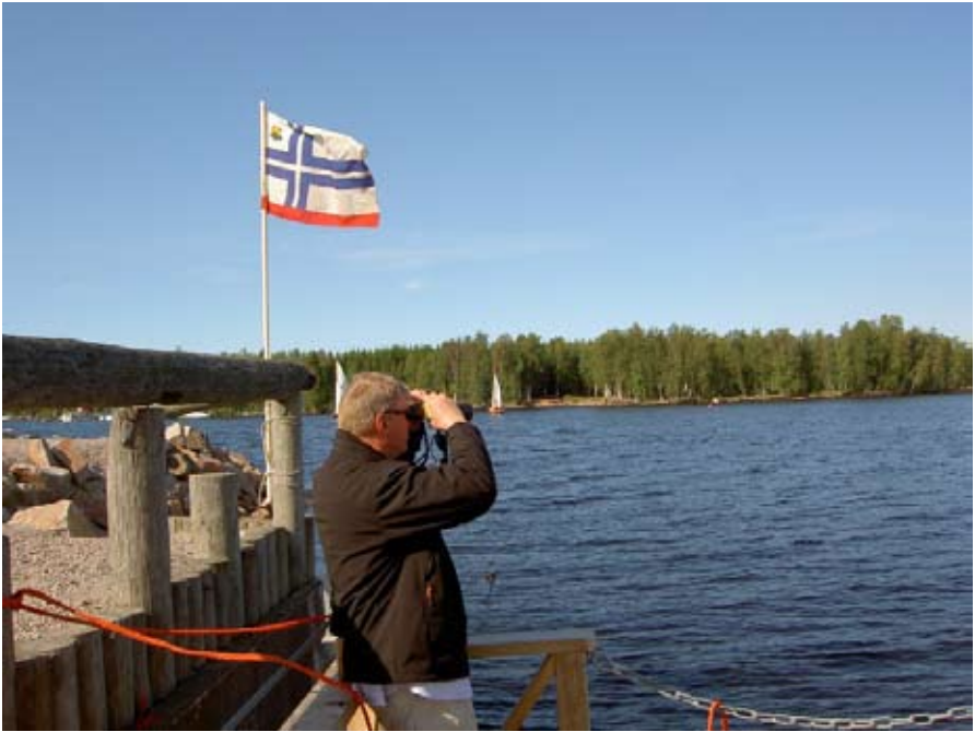
Lautakunta työssään – mihinkäs suuntaan ne menivät.