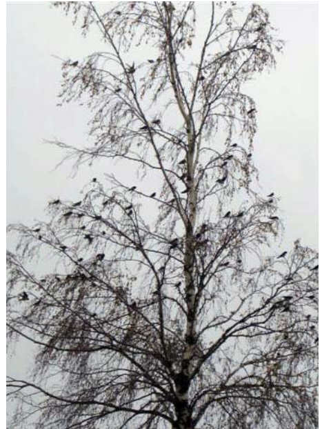
Pääskysket ovat harvemmin koivussa, kuva Röytästä