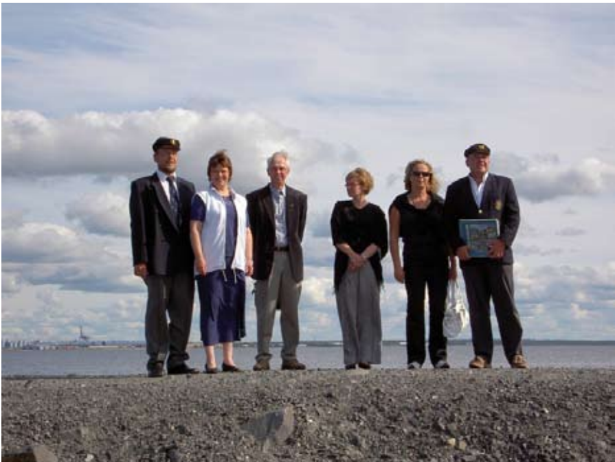
Matkalla onnittelemaan 20 vuotiasta Varjakan Venettä.