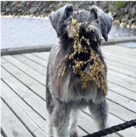
Laivakoiira Venetsialaisnaamiassa Röytässä.