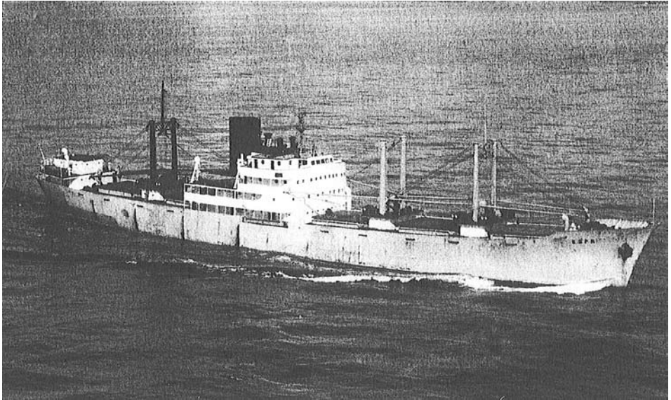
s/s Oscar Gorthon

Vuonna 1955 syystalvella olimme matkalla Lontoosta Kanadan Newfoundlandiin ja siellä St. Johnsin kaupunkiin. Purjehdimme isoympyrää pitkin ja olimme Grönlannin eteläpuolella noin 400 meripeninkulman etäisyydellä. Laiva oli nimeltään s/s Oskar Gorthon, pituudeltaan 110m ja vetoisuudeltaan 3600 dwt. Olin pestautunut tähän ruotsalaisalukseen laivapojaksi. Miehistö oli monikansallinen ja meitä suomalaisia aluksessa oli kolme.