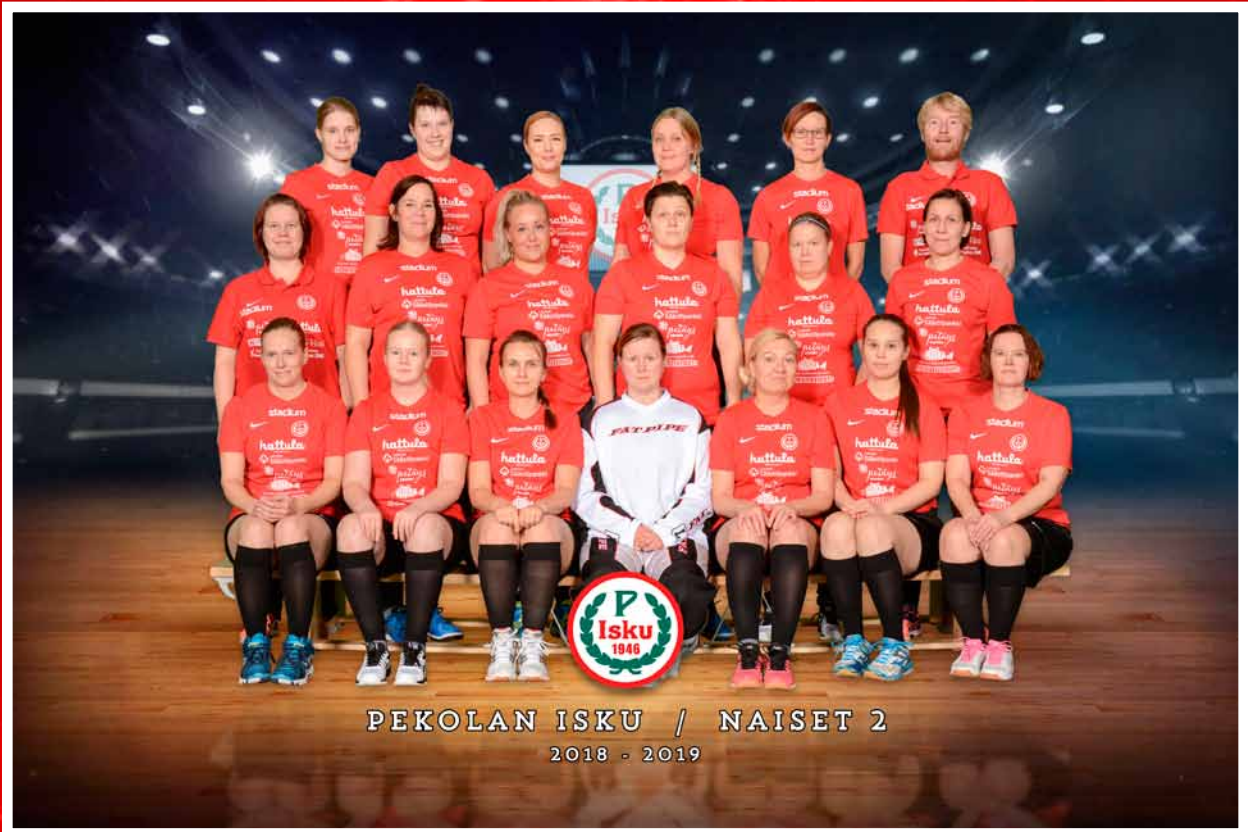
PEKOLAN ISKU / NAISET 2 2018 - 2019