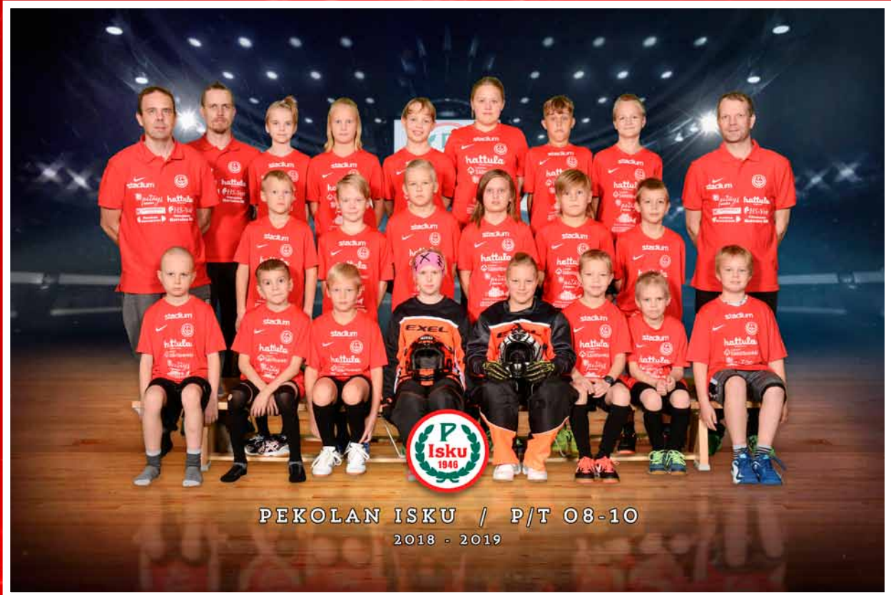
PEKOLAN ISKU / P/T 08-10 2018 - 2019