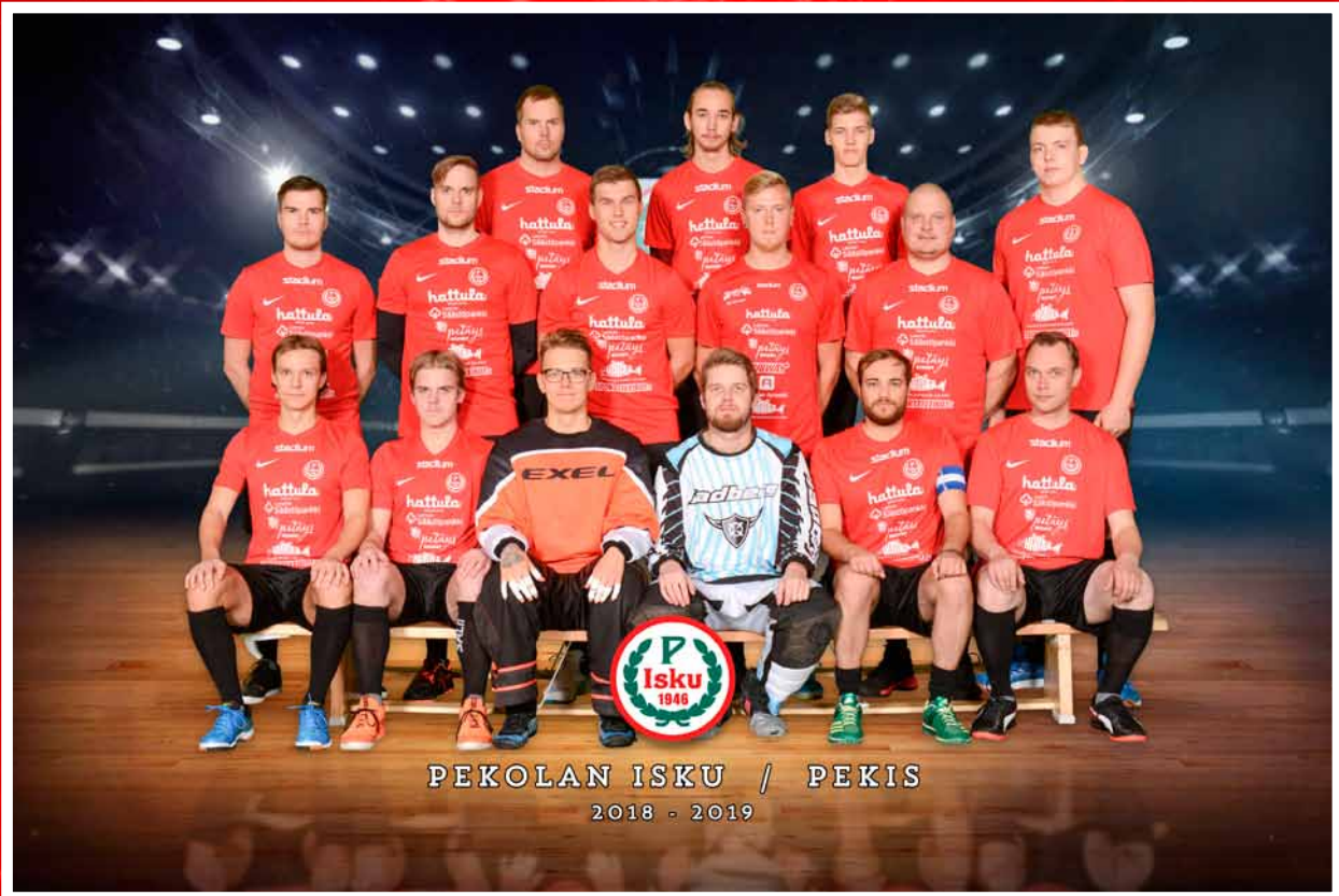
PEKOLAN ISKU / PEKIS 2018 - 2019