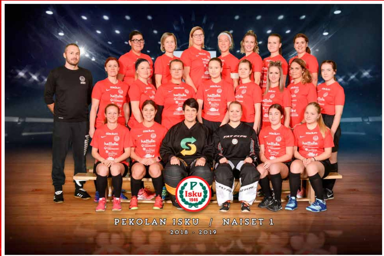
PEKOLAN ISKU / NAISET 1 2018 - 2019