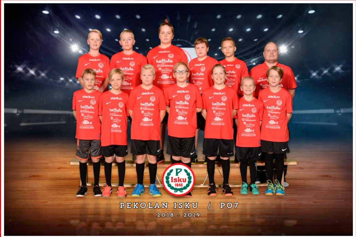
PEKOLAN ISKU / PO7 2018 - 2019