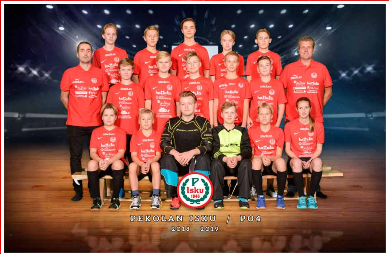
PEKOLAN ISKU / PO4 2018 - 2019