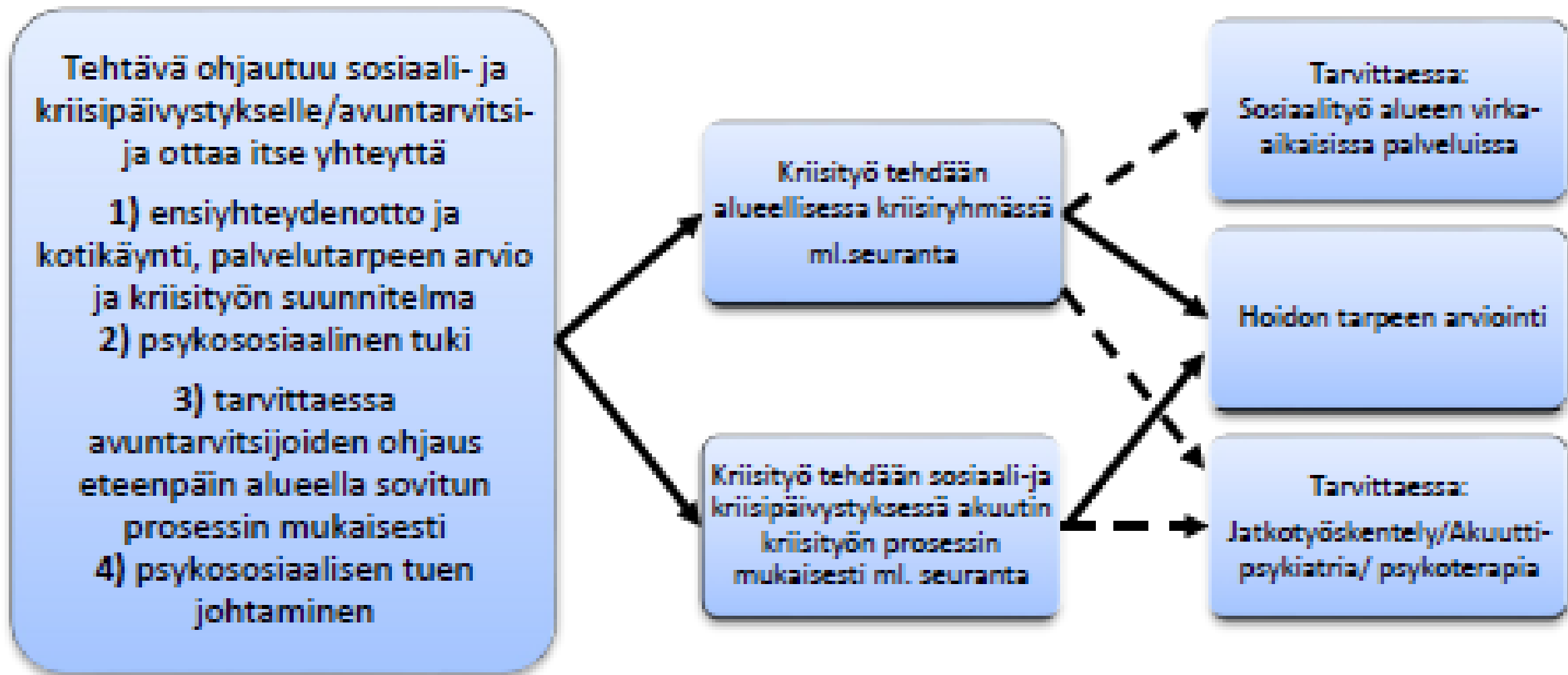
Kaavio 1. Työryhmän suositusten mukainen psykososiaalisen tuen prosessi. Katkoviiva kuvaa mahdollisesti tarvittavia toimia kriisityön lisäksi tai jatkumona.