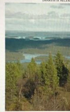
INARIN erämaahan eksynyt kiittää pelastajien toimintaa.

TARKOITUKSENI nyt ei ole puolustella todella tyhmää käyttäytymistäni, kun lähdin liikkeelle ilman minkäänlaisia varusteita. Tahdon