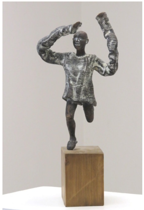
Heidi Piipon veistos "I used to be a lunatic" vuoden 2013 kesänäyttelystä.

Vuosinäyttelyn purku ja teosten poishaku torstaina 6.3.2014 klo 19 - 20. Poishakemattomista teoksista lähetetään 10 euron säilytyslasku. Teosten vakuuttamisesta näyttelyyn huolehtii kukin taiteilija itse.