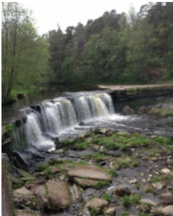
Tallinnan matkan varrelta: Keilajoen putoukset