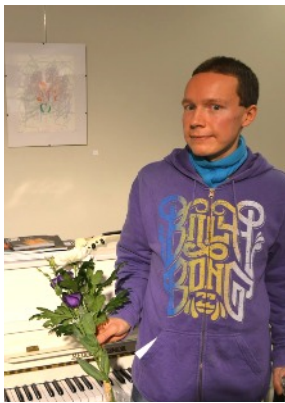
Tatu, kukat ja teos

Yhdistyksemme vuosinäyttely järjestettiin 20.2. - 8.3.2012 Pirkkalassa, Galleria 2:ssa. Jurottajänä toimi Sami Kärppä. Näyttelyyn tarjottiin yhteensä 186 teosta, joista hyväksyttiin 27 teosta 18 eri taiteilijalta.