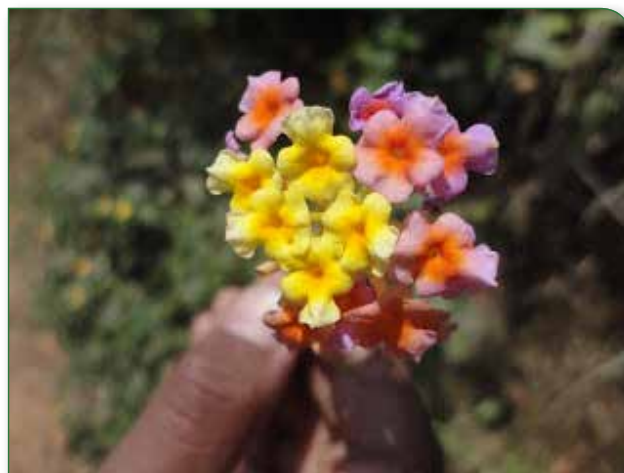
Nepalin kukkasia luontoretkellämme