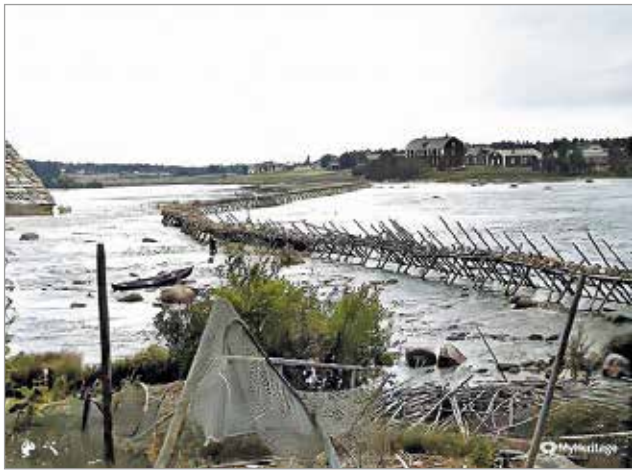
Iijoki on tukittu poikkivadolla

Perinneporinoiden tarinat ja muistelut nauhoitettiin ja niitä hyödynnetään näyttelyä uudistettaessa. Uittomuseon näyttely avataan uudistettuna loppusyksystä. MTR