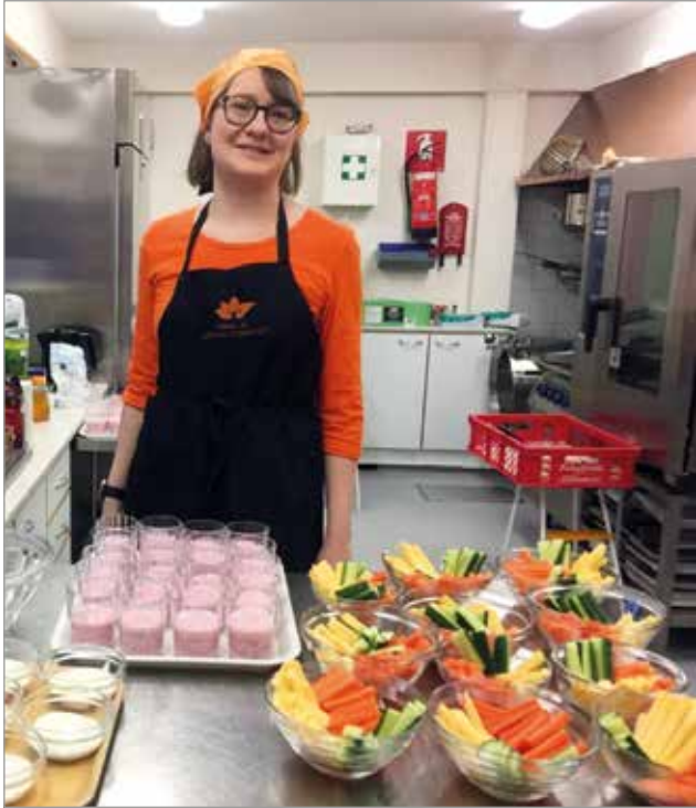
Kasviksilla saadaan väriä ruokapöytään ja ne kuuluvat jokaiselle aterialle.