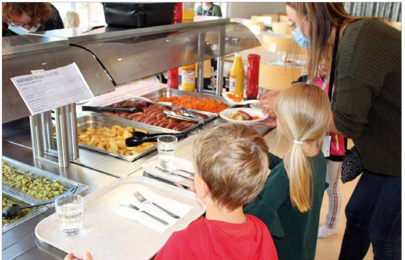
Käristemakkarat ja lohkoperut maistuivat Haminan koulun oppilaille.