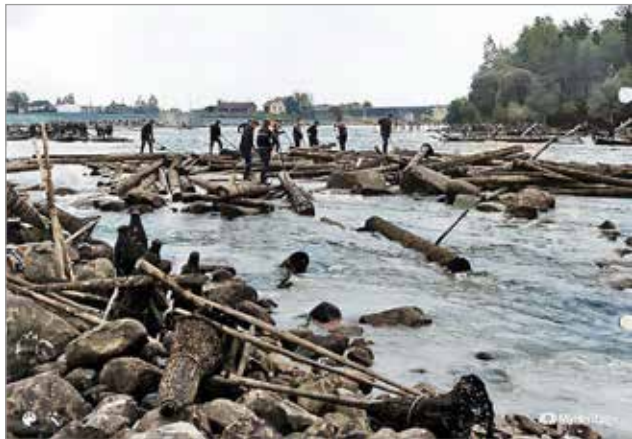
Ruuhkan purkua Kruununsaaressa. Nahkismerrat ovat joutuneet rannalle työtä häiritsemästä.