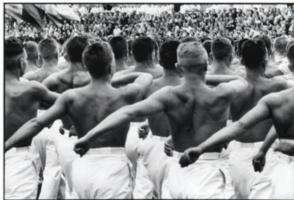
Hieno valokuvanäyttely Ateneumissa. Esillä on Henri Cartier-Bressonin valokuvia 31.1.2016 asti. Valokuvissa näkyy hienosti 1900-luvun maailmaa. LP