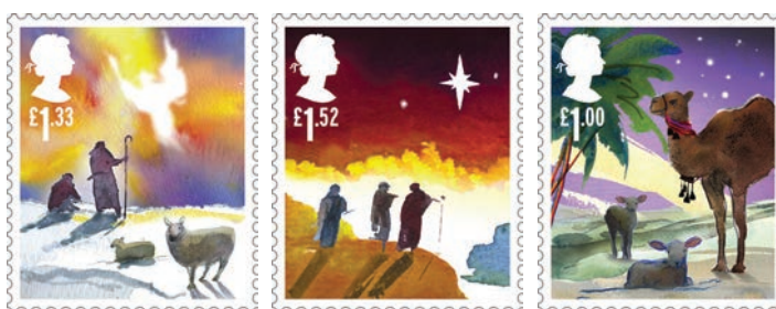
Englannin Royal Postin tämän vuoden joulupostimerkkejä.