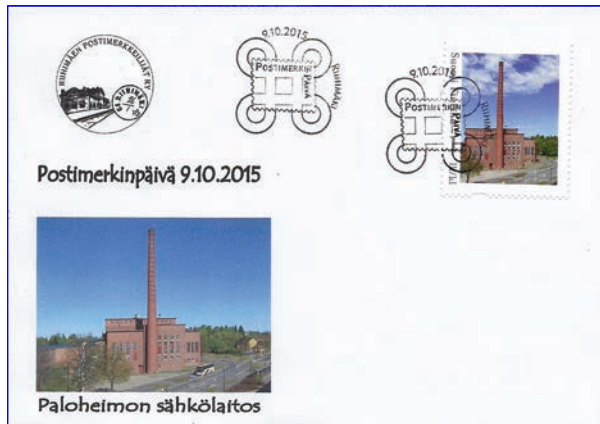
POSTIMERKIN PÄIVÄ – TIENSÄ PÄÄSSÄ?

FORSAN, HYVINKÄÄN, HÄMEENLINNAN, JANAKKALAN, RIIHIMÄEN, TOIJALAN JA VALKEAKOSKEN POSTIMERKKIKERHOJEN TIEDOTUSLEHTI 4/2015, NRO 16