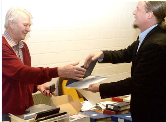
TOIJALAN KERHO 50-VUOTIAS