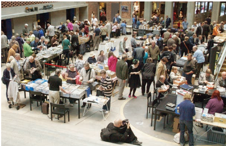
POSTIKORTTIPARATIISI VETI TAAS KERÄILIJÄT HÄMEENLINNAN