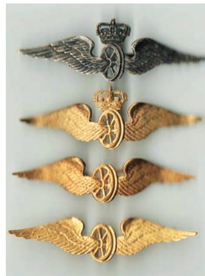
1920 kruunu poistettu

Asemapäällikön virkalakin merkeistä ”nitkutettiin” samoihin aikoihin kruunu pois.