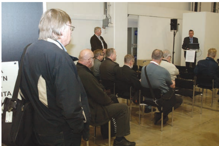
Kuvassa Postimerkkimessujen avajaiset, alla kerhon juliste messuilla.

Hämeenlinnan kerholtahan oli Pitkän matkan luokassa kerhokokoelma, jonka rakentamiseen houkuttelin kerhon hallituksen suostumaan. Kokoelman kohteiden kokoaminen ja rakentaminen jäi tietysti sitten minul-