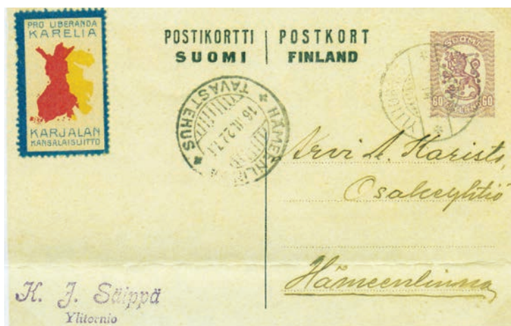
Karjalan Kansalaisliiton julkaisema kirjeensulkijamerkki Hämeenlinna leimalla 16.3.1922.