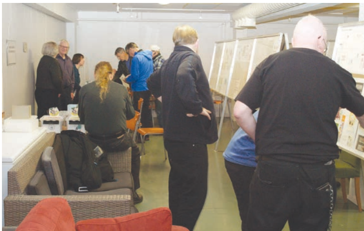
Mukavasti paikallaolijoita selkä vasten aurinkoa.