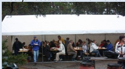
Kesäjuhlassa nautittiin lohikeittoa