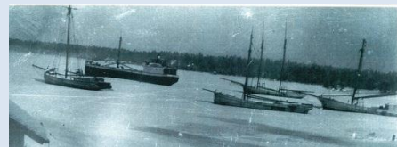
Laivat talvehtivat ja kinkeriväkeä 1920- luvulla