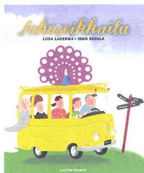
Liisa Lauerma: Sukuseikkailu. Kuvitus Ismo Rekola. Lasten Keskus 2011.