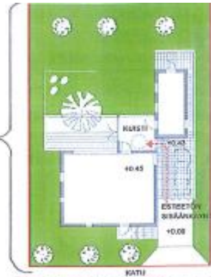
Piirroksen esimerkissä pientalon esteetön sisäänkäynti on järjestetty autokatoksen kautta, jolloin 8 %:n kaltevuus järjestely luontevasti.