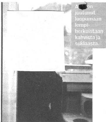
A. [nimi] on joutunut luopumaan lempiherkuistaan kahvista ja suklaasta.

Vatsaa ja nielua polttaa, Seura, 46, 15.11.2012