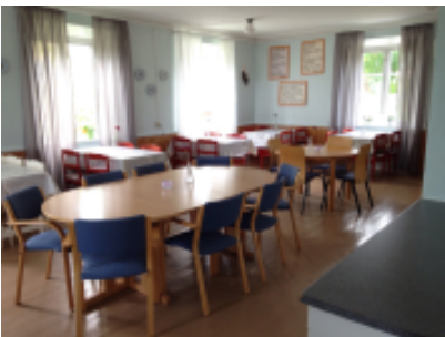
Ruokailutilan uusi ilme.