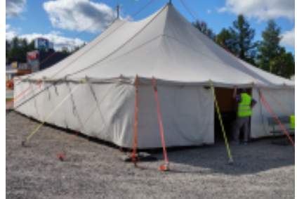
Telttapäivät voi alkaa.