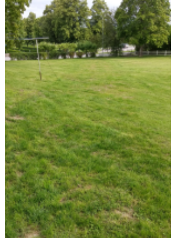
Jumala on antanut kasvun.