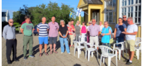
Raamattuviikon osallistujia yhteiskuvassa.