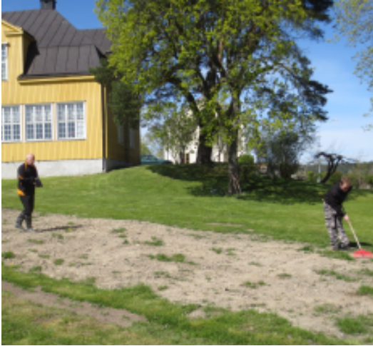
Maan muokkaus ja kylvö keväällä.