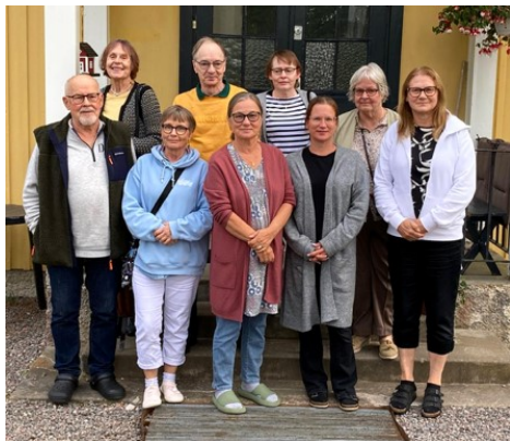
Elijah house ystävien virkistysviikko 18-22/8 (vasemmalla )

Uudenmaan Kansanlähetys järjesti perheleirin Lähetyskodilla (yllä). He tutustuivat Lähetyskotiin ja Finspångin lähiympäristöön. Myös Kolmårdenissa käynti kuului ohjelmaan.